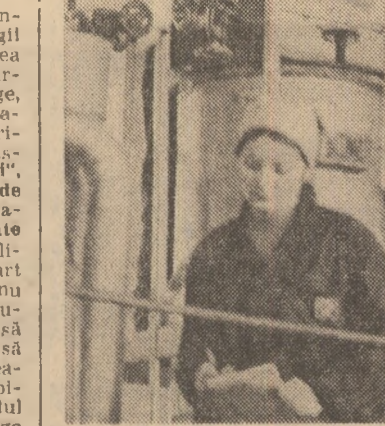
„ZILELE FILMULUI PENTRU ELEVI ȘI STUDENȚI“

Apropiată deschidere a cursurilor școlare și universitare oferă întreprinderii cinematografice a municipiului București prilejul de a organiza, pentru elevi și studenți, un program de filme, care să se adreseze virșiei lor. Acestea sînt grupate în cicluri tematice: Universul copilăriei văzut de cinești, În lumea basmului, Animație de pe toate meridianele. Pentru toți tinerii spectatori, Tineretul în luptă pentru libertate și afirmare socială. Comedii... parodii. Dacă toți tinerii din lume... În intervalul 13-23 septembrie este prevăzută și o premieră a Casei de filme 5, Jachetele galbene (scenariul Ovidiu Zotta, regia Dan Mironescu). Asadar, nu uitați, de astăzi, cinematografele buciurestene își așteaptă în mod special spectatorii din rândul elevilor și studenților. Dar nu numai pe ei, ci, desigur, pe toți tinerii. (I. L.).