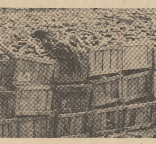
Autocamioane venite tocmai de la Reghin și Făgăraș așteaptă aproape o zi întreagă pentru a fi încărcate, în timp ce pe cîmp cantitățile de ardeie sporesc. Singurii care nu se grăbesc sînt funcționarii de la C.L.F. Oltenia, tocmai cei care au datoria de a valorifica cu operativitate recolta

„Campania merge bine... cu mici excepții”