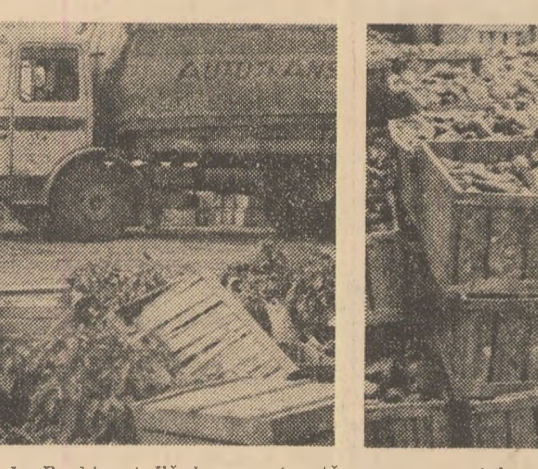
Autocamioane venite tocmai de la Reghin și Făgăraș așteaptă aproape o zi întreagă pentru a fi încărcate, în timp ce pe cîmp cantitățile de ardeie sporesc. Singurii care nu se grăbesc sînt funcționarii de la C.L.F. Oltenia, tocmai cei care au datoria de a valorifica cu operativitate recolta