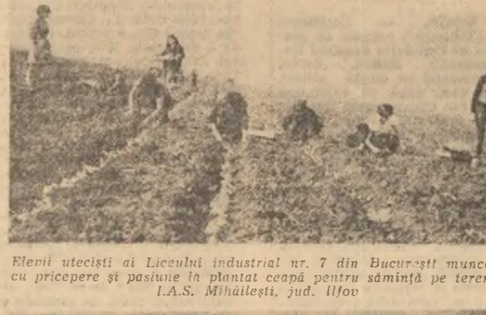
Elevii uteciști ai Liceului industrial nr. 7 din București muncesc cu pricepere și pasiune în plantat ceapă pentru sămânța pe terenul I.A.S. Mihăilești, jud. Ilfov