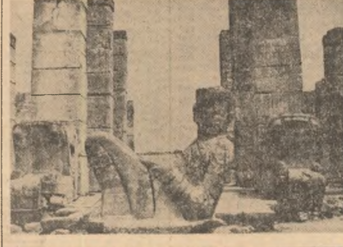
Insemnări din Mexic de N. D. FRUNTELATA