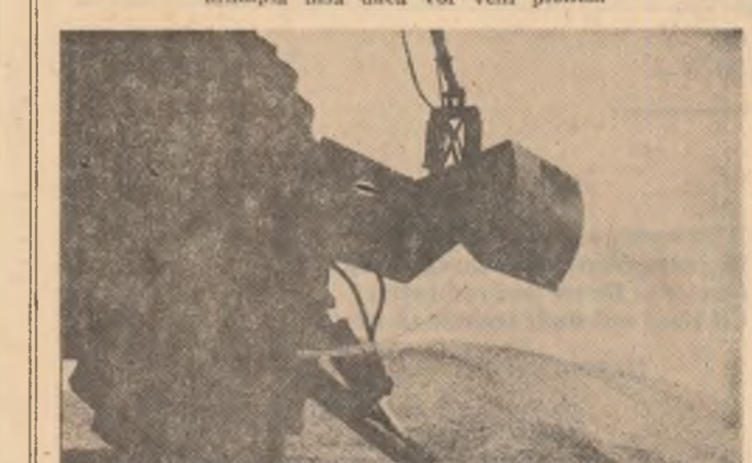
„Caci, galierii din imagine, desi ar putea face față la încetare, așteaptă la rîndul autoamciorne și remorci destinate să transporte porumbul la bazele de recepție