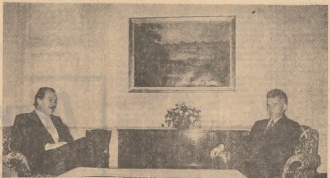
Președintele Republicii Socialiste România, tovarășul Nicolae Ceaușescu, a primit, miercuri, pe ministrul relațiilor externe al Statelor Unite Mexicane, Jorge Castaneda, care a făcut o vizită oficială în țara noastră. La primire a participat tovarășul Ștefan Andrei, ministrul afacerilor externe. A fost de față Emilio Calderon Puig, ambasadorul Mexicului la București. (Continuare în pag. a V-a)

Ministrul relațiilor externe al Statelor Unite Mexicane