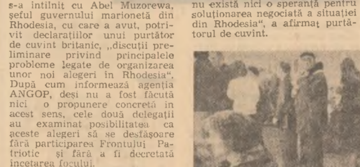
Tinerii reprezintă o parte importantă a celor aproximativ 1,5 milioane de britanici aflați în căutare de lucru

Poporul nostru este incredincios că întâlnirile care începe astăzi va da un nou și puternic îmbold colaborării multilaterale în toate domeniile de activitate între cele două țări și țările noastre. Animati de sentimente profunde de stimă și prietenie, adresăm înaltului oaspete bulgar un călduros salutare tradițional „Bun venit pe pământul românesc”!