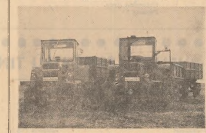
În tot acest timp, la numai 800 de metri, două tractoare cu remorci duble nu au efectuat nici un transport de recoltă toamnă...