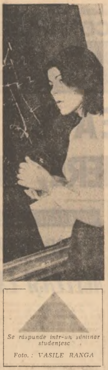
Se răspunde într-un săbîntar studentesc.