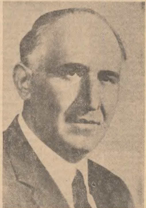
Tovarășul Todor Jivkov s-a născut la 7 septembrie 1911, în satul Pravet, regiunea Sofia, într-o familie de țărani săraci. Într-un timp în rândurile clasei muncitoare bulgare, ca lucrător tipograf, devine, în anul 1928 membru al Uniunii Tineretului Comunist Bulgar, iar în anul 1932 este primit în Partidul Comunist Bulgar care activa în condiții de adică ilegalitate. Dându-se cu abnegație transpuneri în viață a celor mai nobile idealuri ale poporului bulgar, aspirărilor sale de libertate și socialism, tovarășul Jivkov i se încredințează, în perioada 1934-1941, sarcini de conducere în organizații raionale de partid din capitală, devenind membru al Comitetului regional de partid Sofia. În anul 1943 a acționat ca unul dintre organizatorii mișcării de luptă din zona industrială a regiunii Sofia. În septembrie 1944, partidul îl încredințează comanda unităților de partizani și a grupelor de luptă antifasciste concentrate în jurul capitalei. După instaurarea puterii populare, tovarășul Todor Jivkov participă la opera de edificare a viții noi în Bulgaria, îndeplinind funcții de răspundere pe linie de partid și de stat. La a VIII-a Plenară a C.C. al P.C. Bulgar, din 1945, tovarășul Todor Jivkov este ales membru suplent al C.C. al P.C. Bulgar, iar la Congresul al V-lea al partidului, în 1948, membru al C.C. al P.C. Bulgar. În perioada 1948-1949 este prim-secretar al Comitetului orașeneș Sofia al P.C. Bulgar. În 1950 devine membru suplent al Biroului Politic și secretar al C.C. al P.C. Bulgar, iar în 1951 este ales membru al Biroului Politic. Din 1934, de la cel de-al VI-lea Congres al Partidului Comunist Bulgar, tovarășul Todor Jivkov îndeplinește înalta funcție de prim-secretar al C.C. al P.C. Bulgar. În noiembrie 1962 a fost ales (Continuare în pag. a VI-a)

La invitația tovarășului Nicolae Ceaușescu, secretar general al Partidului Comunist Român, președintele Republicii Socialiste România, sosește astăzi într-o vizită de prietenie în țara noastră tovarășul Todor Jivkov, prim-secretar al Comitetului Central al Partidului Comunist Bulgar, președintele Consiliului de Stat al Republicii Populare Bulgaria.