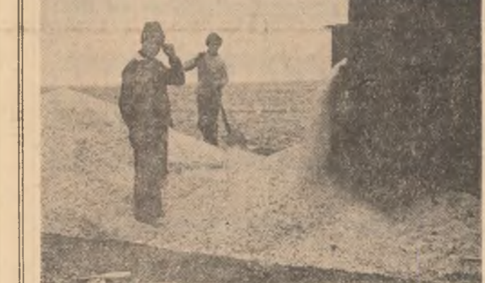
La I.A.S. Lehtiu, punctul terminus al recoltei este drumul de la marginea țării. Gospodarii se întorc în grădini...