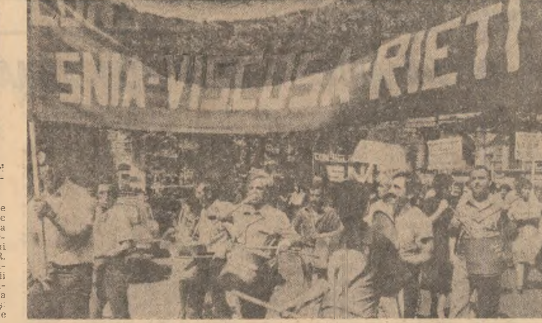
ITALIA — Demonstrație a muncitorilor de la întreprinderile chimice S.N.I.A., desfășurată recent în centrul localității Colferro pentru apărarea locurilor lor de muncă