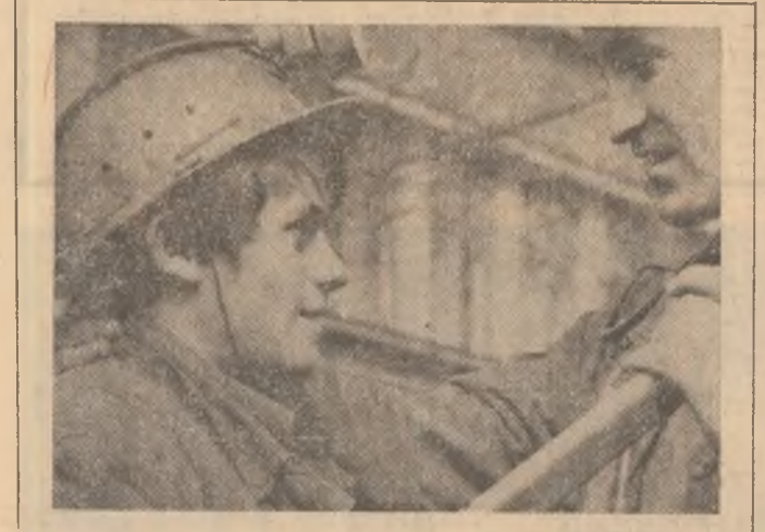
(Continuare în pag. a III-a)

du-ne întreaga noastră adevărată încredere în conținutul documentelor ce vor fi supuse dezbaterii și aprobării marelui forum al comunistilor, dorința izvorâtă din adâncul conștiinței și înimilor noastre ca dămneavoastră să fiți reales în funcția supremă de secretar general al partidului, vă încredințăm, mult iubite tovarășe Nicolae Ceaușescu, că, urmându-vă neabătut strălucitul exemplu de dăruire netărmurită cu care luptați pentru împlinirea idealurilor de progres și prosperitate ale națiunii, oamenii muncii de pe aceste minunate meleaguri sint hotărâți să-și amplifice eforturile în toate domeniile de activitate, pentru a-și aduce o contribuție sporită la înălțarea scumpei noastre patrii pe culmile civilizației comuniste.