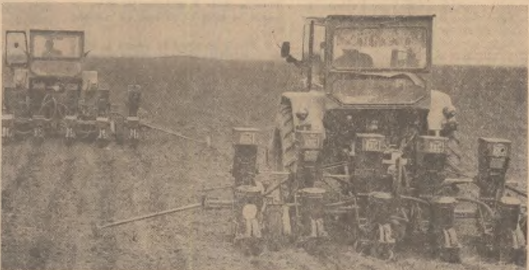
Oamenii muncii din industria județului Suceava au îndeplinit planul la producția globală industrială pe patru ani

toți locuitorii satelor din județul Dimbovița, în frunte cu comunistii, vor munci cu abnegație și responsabilitate pentru a raporta, în cinstea Congresului al XII-lea al partidului, noi și importante succese în realizarea sub semnul calității a tuturor lucrărilor din această toamnă, asigurând astfel baze trainice recoltelor viitoare.