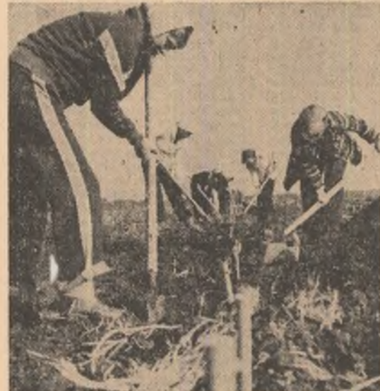
Pe viitorii horticultori din Dragomirești i-am găsit, ieri, executând o serie de lucrări specifice campaniei de toamnă în vederea realizării unor producții sporite de fructe în anii ce vin.