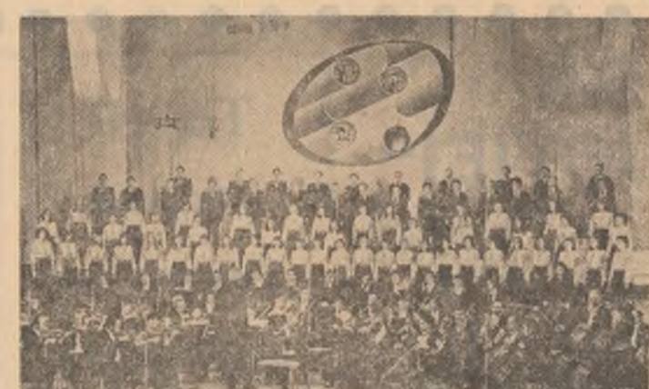
Corul de camera „Preldiu” al Ansamblului artistic al Uniunii Tineretului Comunist

Marți seara, în studioul de concert al Radioteleviziunii române, a început cea de-a III-a ediție a Concursului cîntecului politic pentru tineret și studenți, amplă manifestare artistică și educativă care și-a dobîndit deja un binecunoscut prestigiu în rândul tinerilor, al tuturor iubitorilor muzicii. Actuala ediție a concursului este dedicată celui de-al XII-lea Congres al partidului, fiind un vibrant omagiu adus de către creatorii și interpreții prezenți în cadrul manifestării, de către întreaga generație tînără a țării partidului, secretarului său general, tovarășul NICOLAE CEAUȘESCU.