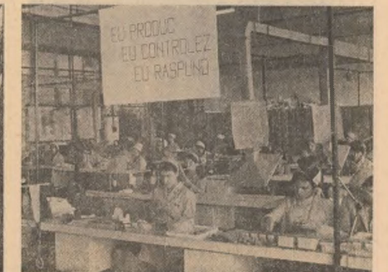
Pagină realizată de ION ANDREIȚĂ