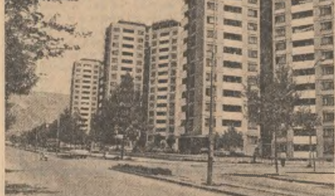
Noile cartiere de locuințe ale orașului Mostar

De asemenea, în zona de suprafață de peste 10.000 ha. Paralel cu lucrările de realizare a acestor importante obiective se vor construi sau moderniza drumurile între localitățile Nevešine — Gacko, Bileca — Stolac, Trebinje — Liubinie și Trebinje — Nikšić.