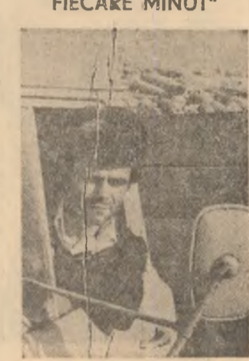
„ACUM ARE PREȚ FIECARE MINUT“