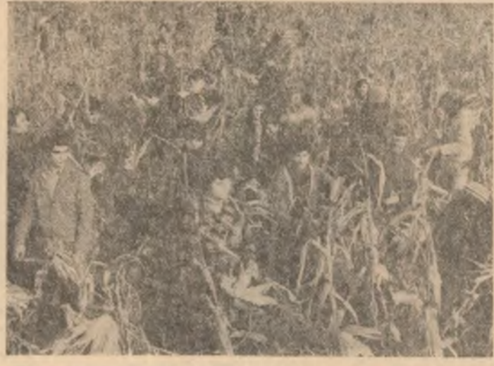
„FAPTELE CU CARE NE MINDRIM“