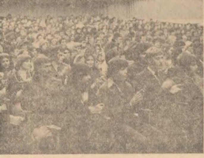
Tinerii gorjani participanți la una din numeroasele manifestări educative organizate la Muzeul de istorie al partidului