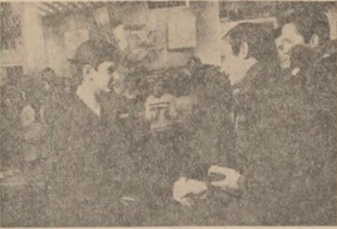
Moment emotionant: In sala Congreselor, generația Congresului al XII-lea primește carnetele de uteciști