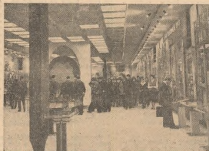
Întîlnirea cu istoria a făuritorilor ei de azi

Ieri, în Capitală, 800 de tineri gorjeni au participat la o entuziastă manifestare utecistă dedicată apropiatului Forum al comuniștilor