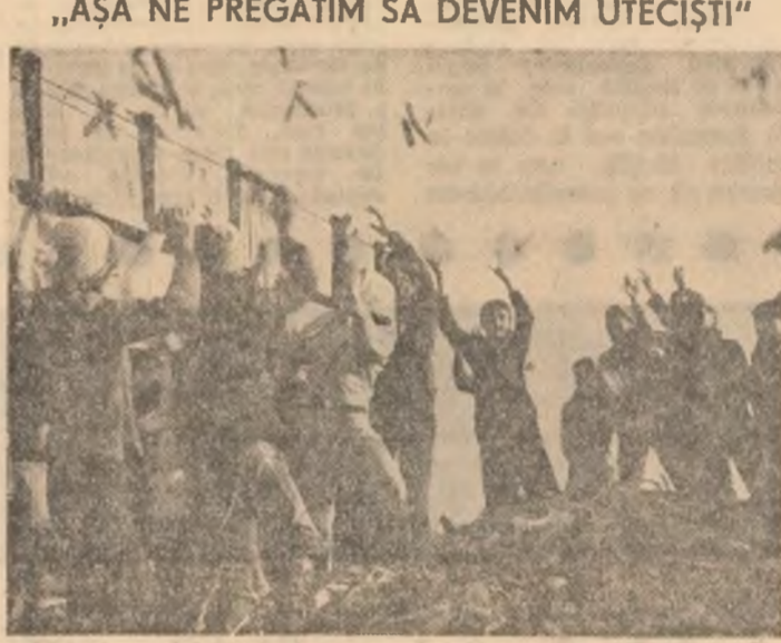
„AȘA NE PREGĂTIM SĂ DEVENIM UTECIȘTI“