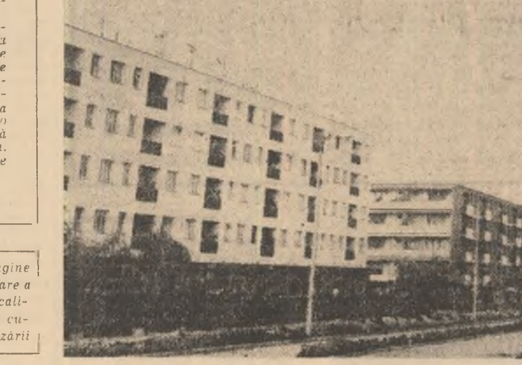
Turnu Măgurele — o imagine a prezentului, o prefigurare a viitorului pentru alte localități din județ care vor cunoaște ritmurile urbanizării