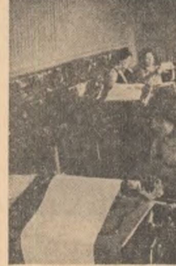
U.R.S.S. — Imagine din stătuia de calul a sovhozului „Ghigant” din regiunea Rostov, una dintre modelele unității ale agriculturii sovietice

Deschisă în anul celei de-a 35-a aniversări a revoluției de eliberare națională și socială, la scurt timp după Congresul al XII-lea al Partidului Comunist Român, expoziția înfățișează suferințele, prin cele peste 1.000 de exponate prezentate în standuri, prin grafice și imagini dezvoltarea impetuasă a chimiei românești și a schimburilor comerciale externe cu produse chimice