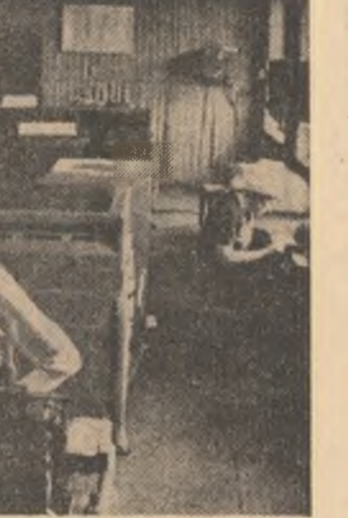
U.R.S.S. — Imagine din stătuia de calul a sovhozului „Ghigant” din regiunea Rostov, una dintre modelele unității ale agriculturii sovietice

La Budapesta au fost date publicității „Tezele Comitetului Central al P.M.S.U. pentru al XII-lea Congres al partidului”