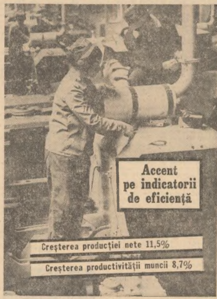
Accent pe indicatorii de eficiență. Creșterea producției nete 11,5%. Creșterea productivității muncii 8,7%.

1 Pentru noi, 1980 va fi un an de realizări și răspunderi speciale. În luna 1980 trebuie să punem în funcțiune primul obiectiv în cadrul uzinei, și anume gospodăria de apă nr. 4, creînd astfel condiții de respectarea termenelor de intrare în circuitul producției și celorlalte obiective: bazele de cocsificare 7 și 8, instalațiile