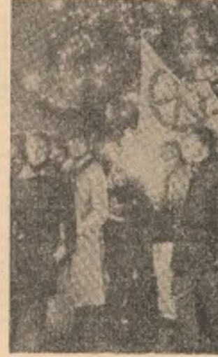
DANEMARCA — Aspect din timpul unei recente demonstrații desfășurate la Copenhaga în semn de protest față de hotărîrea N.A.T.O. de amplasare a noi tipuri de arme nucleare în Europa occidentală

LA ISLAMABAD au început convorbirile oficiale între președintele Pakistanului Zia-Ul-Haq, și președintele Republicii Djibouti, Hassan Gouled Aptidon, aflat, începînd de duminică, într-o vizită de stat de 5 zile în capitala pakistaneză — informează agenția INA.