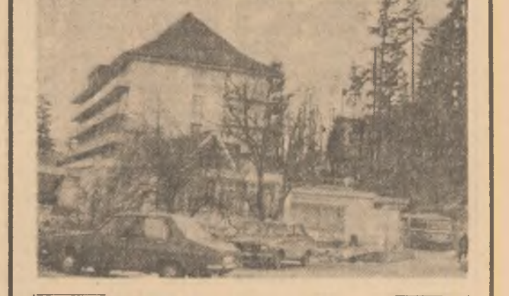
Amplasată în pitoreasca zonă a Neamului, stațiunea balneo-climaterică Băilești este tot mai bine circumscrisă rețelei unităților de odihnă și agrement din munții noștri. Pornind de aici se poate ajunge la Văratec, Agapia, Tîrnava Neam, locuri de unde Ceahlăul ni se arată în toată măreția lui.