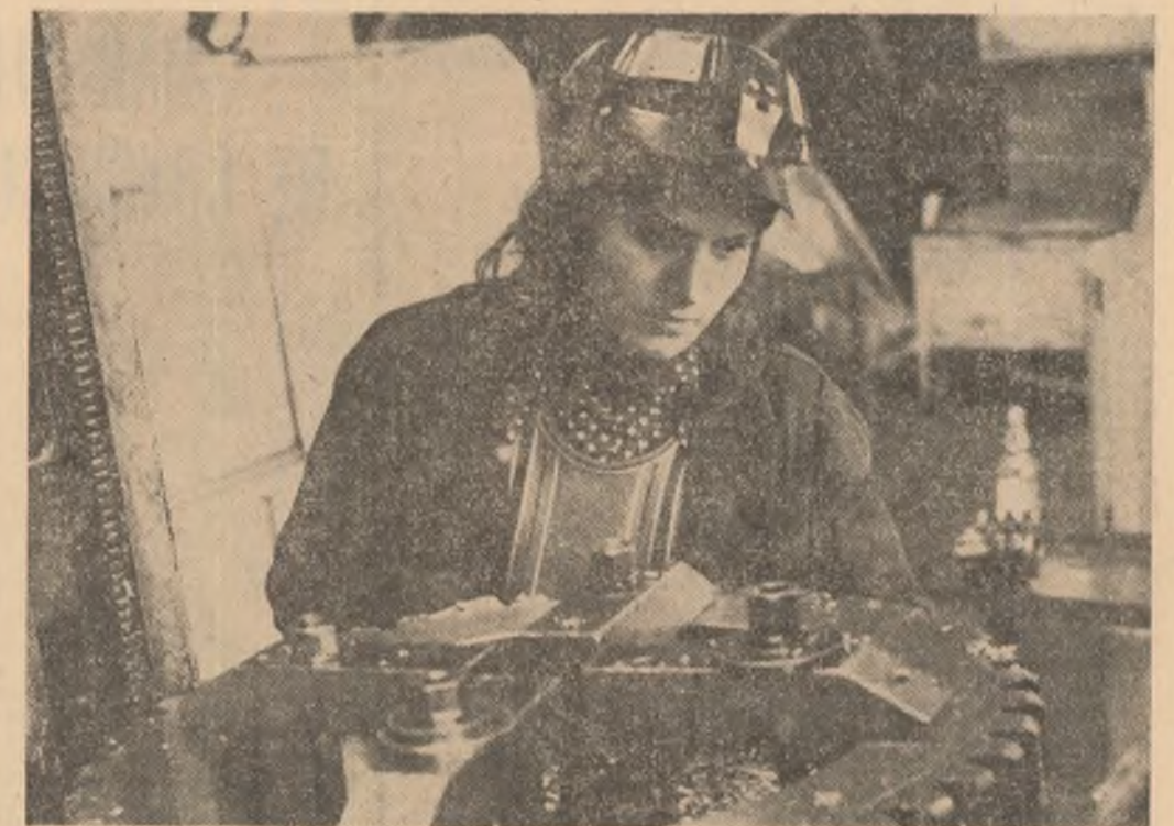
Policalificarea și polideservirea — acțiuni care participă mulți tineri de la secția strîngărie I a Întreprinderii de mecanică navală din Constanța.

Cu acest prilej a avut loc o convorbire care s-a desfășurat într-o atmosferă caldă, tovarășească.