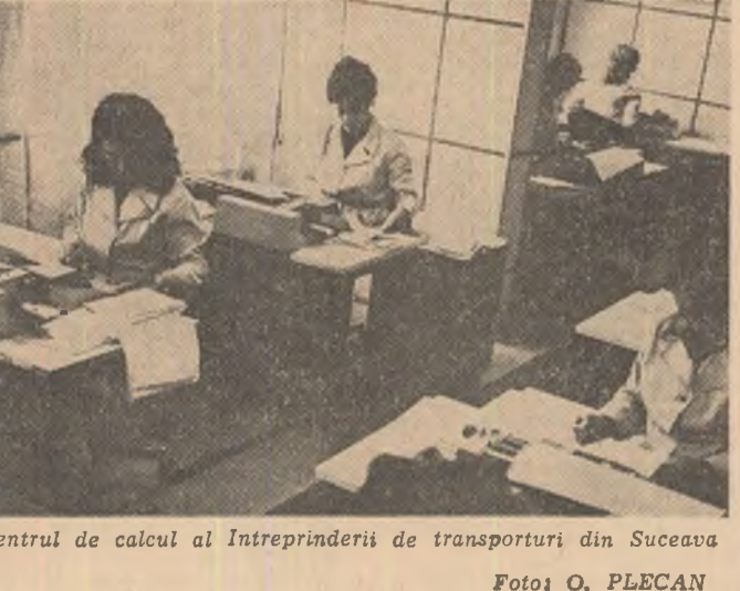
Centrul de calcul al Întreprinderii de transporturi din Suceava.