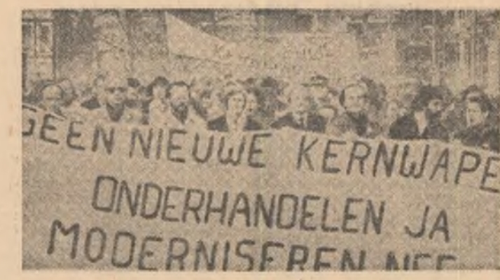
OLANDA — Aspect din timpul unei ample demonstrații pentru oprirea cursei inarmărilor și dezarmare, împotriva deciziei N.A.T.O. de a amplasa noi rachete nucleare în Europa occidentală

Ambasadele Republicii Socialiste România din U.R.S.S., R.S. Cehoslovacă, Argentina, Mexic, Brazilia, Canada și Israel au organizat conferințe de presă, seri culturale, precum și alte manifestări, în cadrul cărora au fost subliniate semnificațiile istorice ale hotărîrii adoptate de cel de-al XII-lea Congres al P.C.R., marile realizări ale poporului român în anii construcției socialiste, indisolubil legate de întreaga activitate a tovarășului Nicolae Ceaușescu. De asemenea, în cadrul acțiunilor consacrate în Uniunea Sovietică înaltului forum al comunistilor români, lectori ai C.C. al P.C.R. au ținut expuneri în ora-