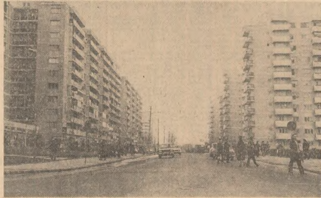
De o parte și alta a Bulevardului Doamna Ghica din Capitală strălujesc blocuri cu o plăcută arhitectură.