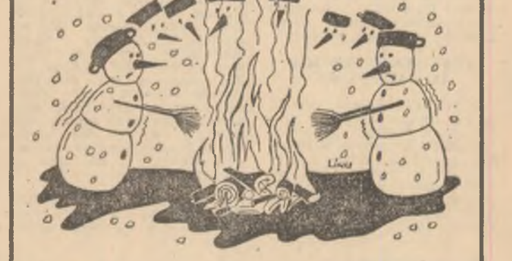
Desen de FLORIN ȘTEFĂNESCU

60 de elevi ai secției de mecanică a Liceului Industrial din Zimnicea, conduși de profesorii-ingineri, maistrilor-instruciori, au întreprins o excursie de documentare la întreprinderea „Republi-că” din Capitală în scopul unei temeinice pregătiri pentru proiectele de diplomă. (Prof. MARIN GH. CAZACU)