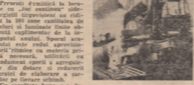
La Întreprinderea „Porțile de Fier“ din Tulcea, oamenii muncii au început cu bune rezultate...