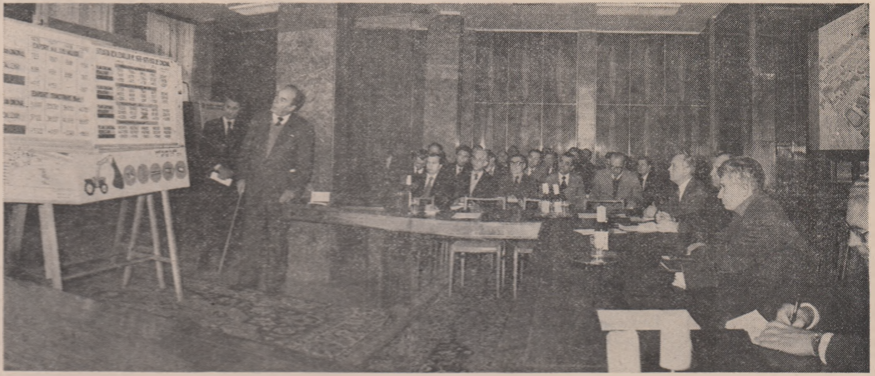
se evidențiază eficacitatea tipizării în acest domeniu, ceea ce a condus, de asemenea, la asigurarea unor importante economii de metal.

se evidențiază eficacitatea tipizării în acest domeniu, ceea ce a condus, de asemenea, la asigurarea unor importante economii de metal. În scula de muncă, vizita secretarului general al partidului a fost marcată de un moment deosebit pentru istoria contemporană a acestui marci: în prezența tovarășului Nicolae Ceaușescu, parcurînd banda de montaj tractoare cu numărul de fabricație 120.998. În aplaudurile celor prezenți, secretarul general al partidului adresîndu-se colectivului întreprinderii, călduros felicitînd pentru acest succes. La încheierea vizitei în secția de fabricație ale utilajilor, tovarășul Nicolae Ceaușescu i se prezintă întregă gamă de tractoare industriale, cu puteri, gabarite și utilități diferite care au intrat în fabricație de serie în 1979 sau sînt în curs de asamblare pentru anul curent și viitorul anului. Se remarcă, între altele, noile tipuri de tractoare realizate în specialitate la întreprinderea de mașini agricole, care au intrat în fabricație de serie în 1979 sau sînt în curs de asamblare pentru anul curent și viitorul anului. Se remarcă, între altele, noile tipuri de tractoare realizate în specialitate la întreprinderea de mașini agricole, care au intrat în fabricație de serie în 1979 sau sînt în curs de asamblare pentru anul curent și viitorul anului.