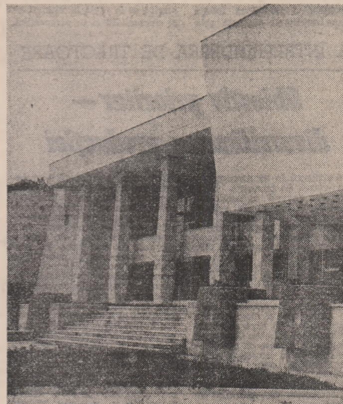
Casa de cultură din Sf. Gheorghe