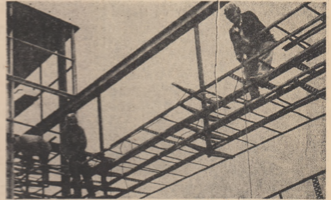
Pe scarile scării întreprinderii de piese forjate și matritate din Drobeta-Tr. Severin, ritmul înalt al muncii oferă posibilități bune la volanul punerii la timp în funcțiune a noului obiectiv