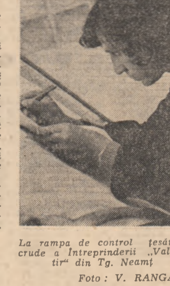
La rampa de control, jehășturi crude a întreprinderii „Valoartir” din Tg. Neamț

DAN MUCENIC CONSTANTIN STAN (Continuare în pag. a 11-3)