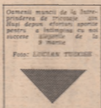
Oameni muncii de la întreprinderea de tracțiune din Blaj după eforturi sporite pentru realizarea obiectivelor de la începutul anului.

reparată și va fi ridicată pentru endocare, și electrică noi, prin forțele tinerilor, deci în sfîrșit creșterea programului, căutarea de concordanțe. Este și o acțiune pe care o vom desfășura cu 200 de tineri timp de 3 săptămîni, și de zi, o lucrare a cărei eficiență se ridică la 5000 lei.