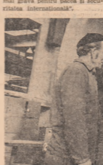
R. S. CEHOSLOVACA. Imagine de la întreprinderea metalurgică din orașul Hradec Králové

După festivitatea inaugurării, pavilionul românesc a fost vizitat de generalul Abdel Magid Hamid Khalil, prim-vicepreședinte al Republicii Democratice Sudan, Farouk Al Magboul, ministrul cooperării, comerțului și aprovizionării, de alte oficialități sudaneze, care au exprimat și cu această ocazie satisfacția pentru participarea României la Tîrg, acțiune ce se înscrie în contextul bunelor relații româno-sudaneze. Totodată, au fost elogiate succesele remarcabile ale industriei românești, precum și modul de organizare și prezentare a produselor.