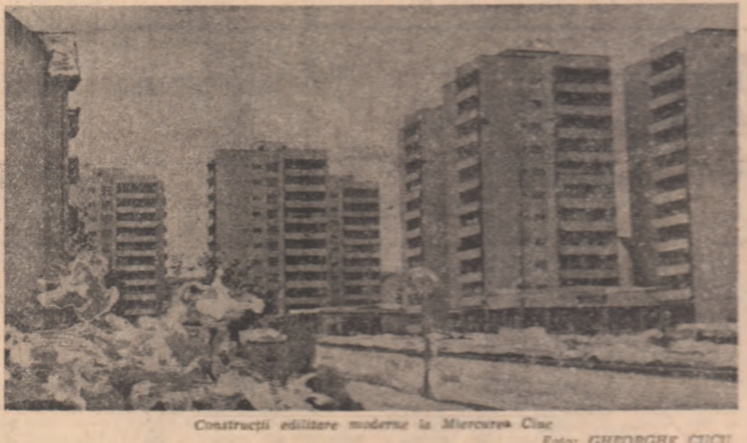
Construcții edificare modernă la Miercurea Ciuc.