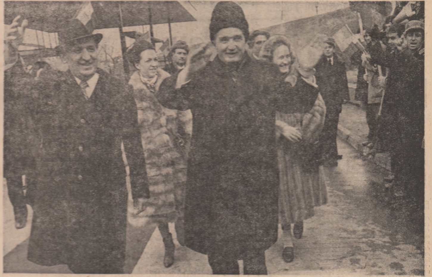
Numeroși oameni ai muncii români și bulgari își exprimă deplina satisfacție față de noua întâlnire dintre tovarășul NICOLAE CEAUȘESCU și tovarășul TODOR JIVKOV

Nouă și semnificativă pagină în bogata cronică a legăturilor tradiționale româno-bulgare, a raporturilor de prietenie și bună vecinătate dintre cele două țări și popoare