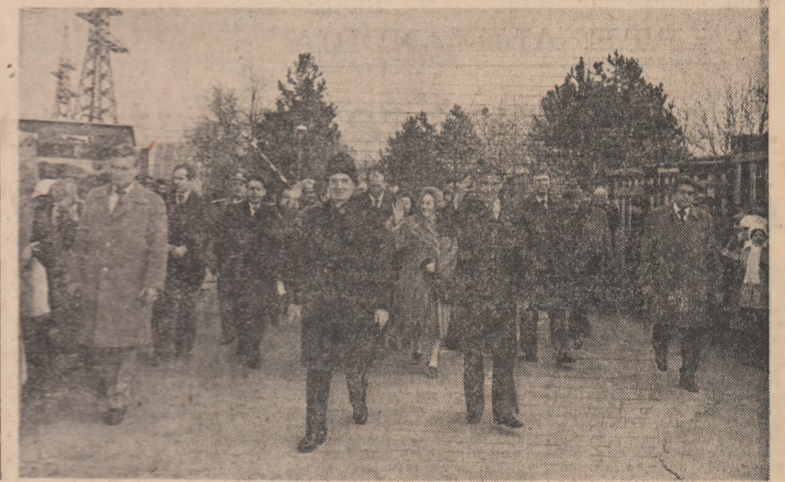
(Continuare în pag. a III-a)