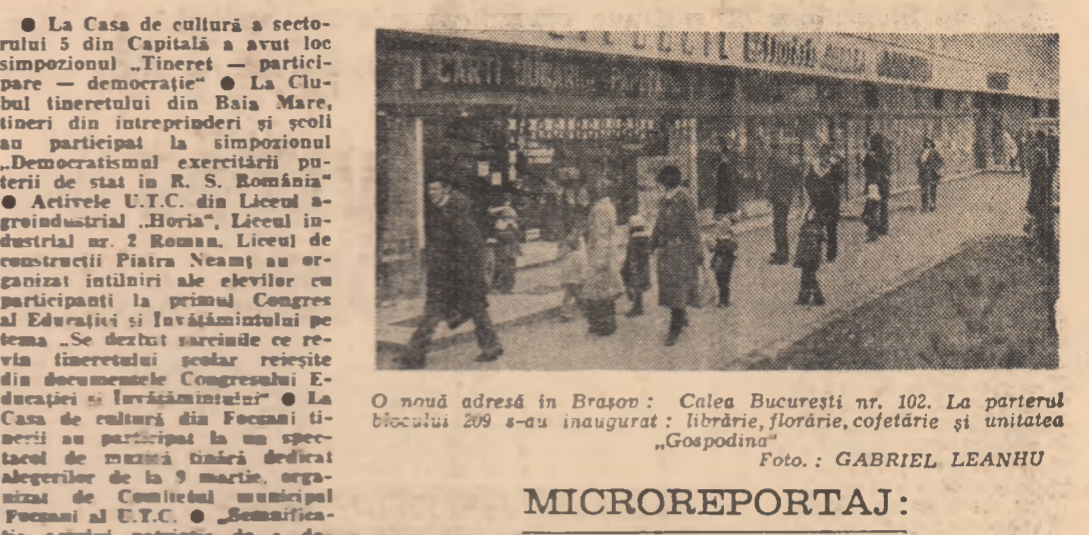
O nouă adresă în Brason: Calea București nr. 102. La parterul blocului 209 s-a inaugurat: librărie, cofetărie și unitatea „Gospodina”