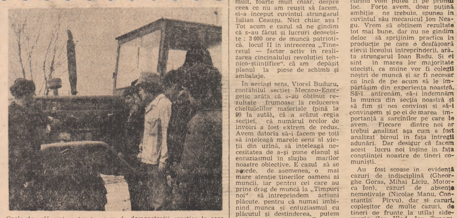
Orele de sală sînt susținute acum de demonstrații practice la care sînt invitați tinerii nu numai să privească, ci să-și verifice cunoștințele teoretice, fiind mai bine datele problemei, apropiindu-și tot mai mult de obținerea carnetului de conducere — certificatului lor de intrare într-o nouă profesie, cea de mecanizator

ST. DORGOȘAN (Continuare în pag. a II-a)