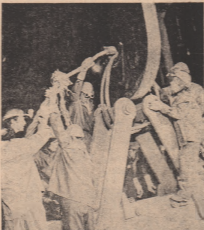
SOLUȚII CE ÎȘI ARGUMENTEAZĂ EFICIENȚA