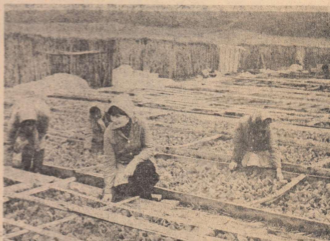
În vînzările cooperativei agricole din Drăgănești Vlăsca — Teleorman se pregătesc culturile pentru plantatul în cîmp. Nu peste multă vreme, o parte din aceste trușandale vor lua drumul consumatorului