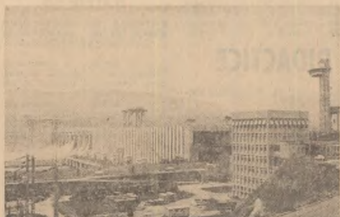
hidroenergetic și de navigație Porțile de Fier I, cea mai strălucită cetate a luminii românești. Hidrocentrala, care a îmbilnit furia fluviului, are o putere instalată de 2100 MW, dintre care 1050 pe partea românească. Sala turbinelor din penultima fotografie este dotată de turbine Kaplan, cele mai mari de acest tip din lume, adevărați coloși metalici, în care numai greutatea butucului este de 140 de tone, performanță remarcabilă a mun-