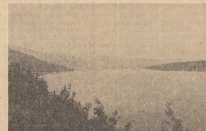
În zona Cazane - Porțile de Fier, așa cum ne este înfățișată în prima fotografie, pînă nu demult doar munte și apă, se afla cea mai concentrată sursă de energie hidroelectrică din Europa, fluviul irasind nepăsător numai în acest sector peste 10 miliarde kilowați anual. Aici, în mijlocul acestui mîret și sălbatic peisaj, unde Dunărea spumegă, în dreptul localității Vîrciorova - Gura Văii, fotoreporterul nostru immortalizează pe pelicula citoria, începută din septembrie 1964, în colaborare cu Iugoslavia, nodul