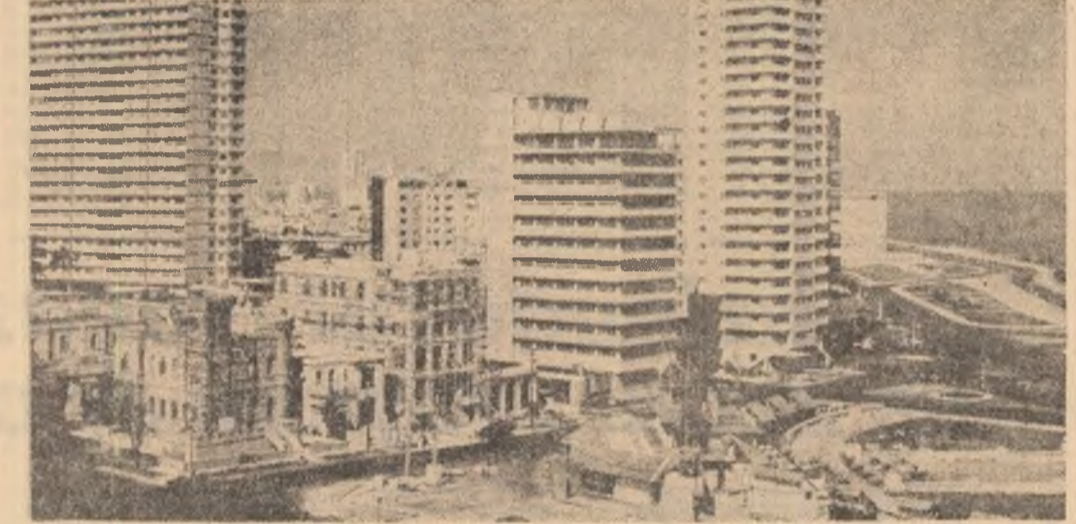
Construcții moderne la Havana, capitala Cubei

SAN SALVADOR 7 (Agerpres). — La sfârșitul săptămânii trecute, au avut loc în Salvador mai multe ciocniri armate între membri ai organizațiilor populare și elemente ale Gărzii Naționale... transmite agenția Prensa Latina.