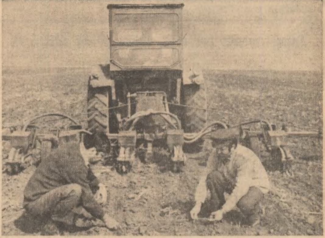
Acolo unde condițiile climatice permit:

ANUL XXXVI SERIA II. Nr. 9 602 4 PAGINI 30 BANI MARȚI 8 APRILIE 1980