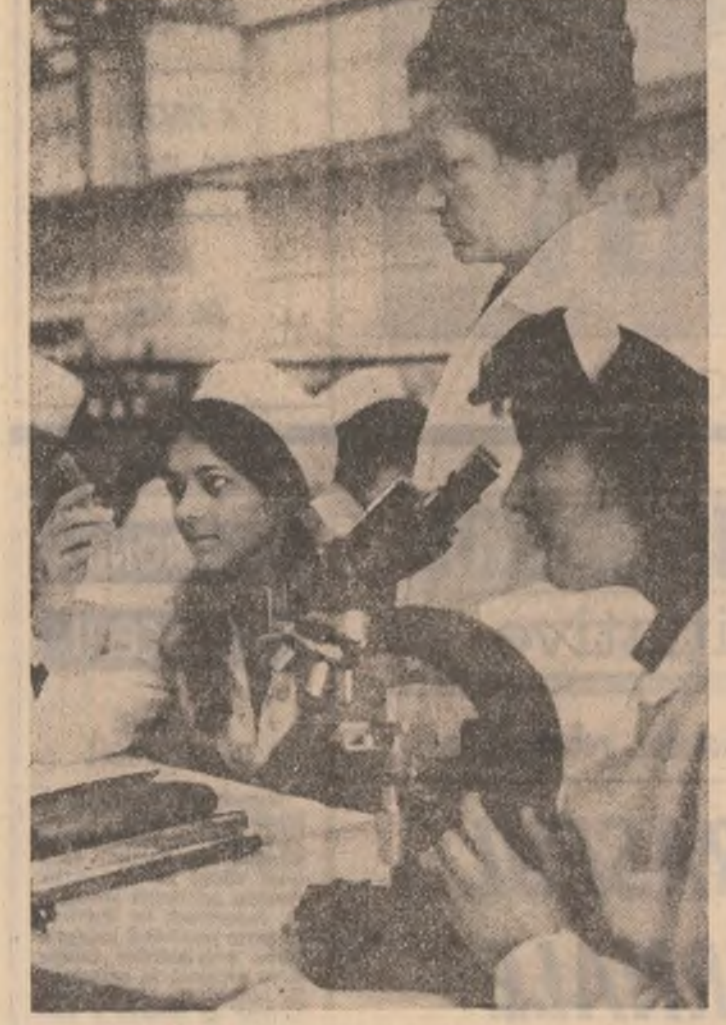
In laboratorul de biochimie