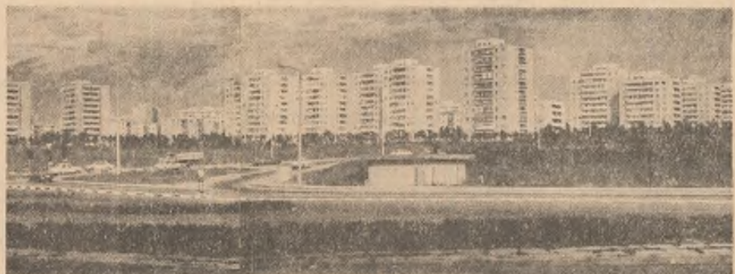
Cartierul Tomis din Constanța