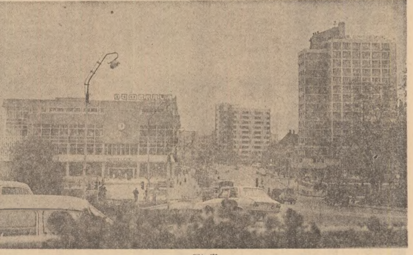
Sibiu '80

MIERCURI, 28 MAI Opera Română: FREISCHUTZ — ora 19; Teatrul „Lucia Sturdza Bulandra” (Schimb Magureanu): GIN-RUMMY — ora 19:30; (Sala Studio): CUM SE NUMEAU CEI PATRU BEATLES — ora 19:30; Teatrul de Comedii: DON JUAN — premieră — ora 19:30; Teatrul „Cl. Notara” (Sala Magheru): MAREA LUMINĂ — ora 19:30; (Sala Studio) INELE, CERCEI, BETEALĂ — ora 19; Teatrul Mic: NEBUNA DIN CHAILLOT — ora 19:30; Teatrul Foarte Mic: STOP PE AUTOSTRADA — ora 20; Teatrul „Ion Văduțiu”: REVELION LA BALA CU ABURI — ora 19:30; Teatrul Giulești (Sala Malestic): ECHIPA DE ZGOMOTE — ora 19:30 (Sala Giulești): COMEDIE FĂRĂ TITLU — ora 19:30.