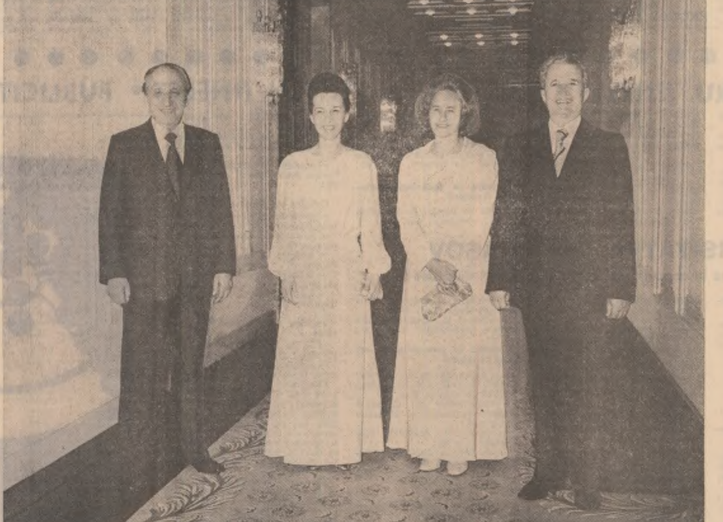
Înainte dineului oficial

Converbirile au loc într-o atmosferă de căldă prietenie, înțelegere și stimă reciprocă.