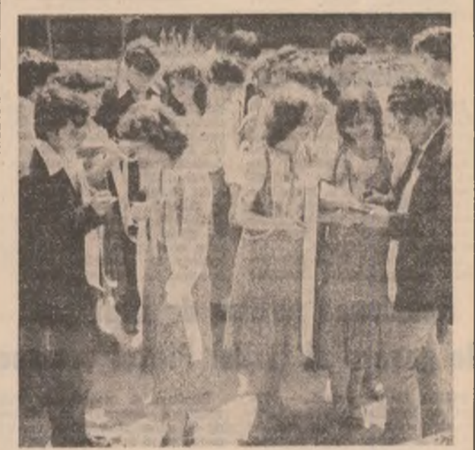
De mine, pentru mii de elevi, mult asteptata vacanță mare! Moment emoționant, întrucât de nostalgia adolescenței, de stăe și proiecte înarmate. Drum bun, de pe inscripția traicete ale vacanței, absolvenților, mari și mici, ai anului școlar!