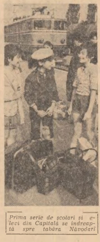
Prima serie de școlari și elevi din Capitală se îndreaptă spre tabăra Năvodari

luționar în care este gândit proiectul omului multilateral și procesul material de realizare a lui. Este aceasta, totodată, temeiul deschiderii funciare spre nou a procedurii de formare a tipului uman specific societății socialiste, proces prin excelență economic și social. Argumentele care pledează în favoarea realității bogate, dinamice, pe care se sprijină, se întemeiază opțiunea pentru formarea personalității multilaterale comportă o varietate pe