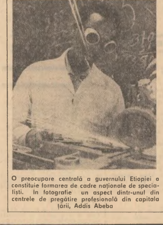
O preocupare centrală a guvernului Etiopiei o constituie formarea de cadre naționale de specialiști. În fotografie un aspect dintr-unul din centrele de pregătire profesională din capitala țării, Addis Abeba

Întărirea sectorului de stat al agriculturii, lichidarea dependenței de piața externă, satisfacerea cerințelor interne de produse alimentare constituie obiectivele centrale ale planului trienal aprobat în 1979 de guvernul panamez în vederea dezvoltării sectorului agricol. În cursul planului amintit autoritățile și-au propus să sporească investițiile în producerea de banane, cafea, zahăr, care constituie articolele tradiționale de export. Se prevede acordarea de asistență financiară și tehnică