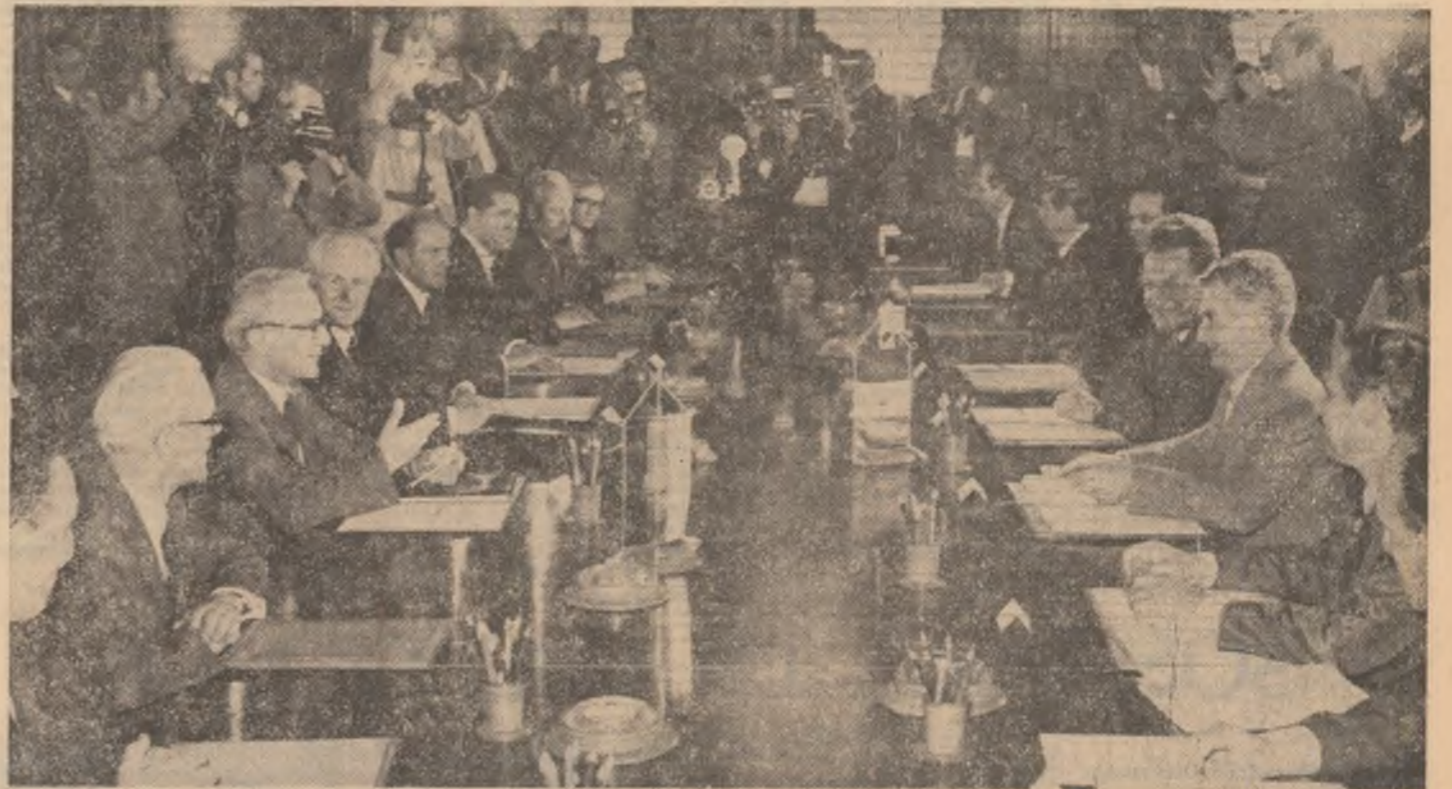
La Palatul Consiliului de Stat au început, miercuri, 25 iunie, convorbirile oficiale între tovarășul Nicolae Ceaușescu, secretar general al Partidului Comunist Român, președintele Republicii Socialiste România, și tovarășul Erich Honecker, secre-