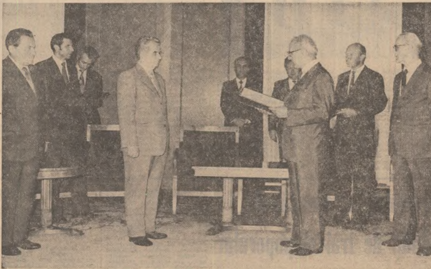
Tovarășului Nicolae Ceaușescu, secretar general al Partidului Comunist Român, președintele Republicii Socialiste România, i-a fost înmănat în cadrul unei solemnități care a avut loc, miercuri după-amiază, la Palatul Consiliului de Stat, Ordinul „Karl Marx”, conferit cu prilejul împlinirii vârstei de 60 de ani și a peste 45 de ani de activitate revoluționară, pentru merite deosebite în lupta pentru pace și solidaritate, pentru în-