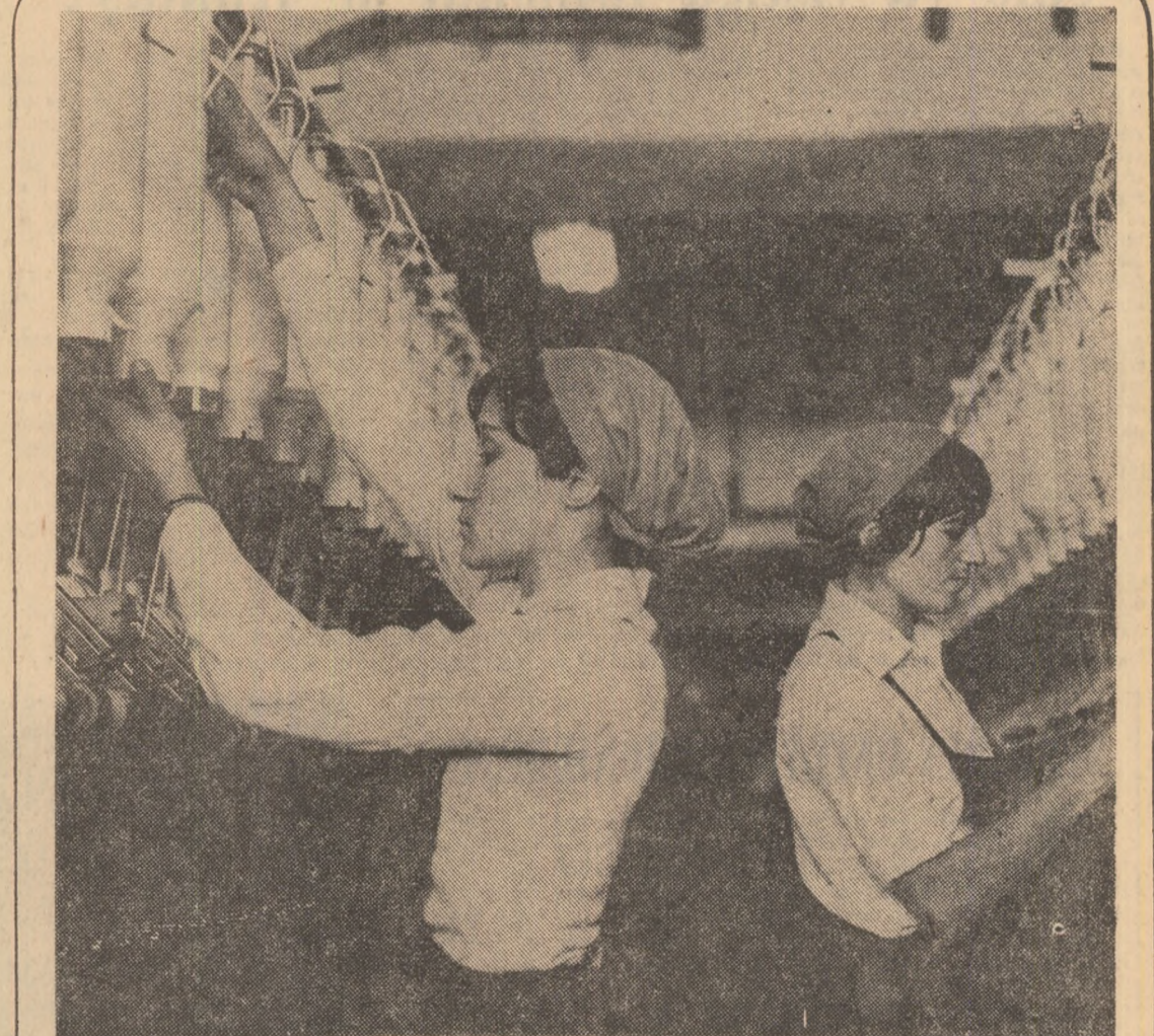
La întreprinderea textilă „Oltul” din Slatina

Tovarășul Nicolae Ceaușescu, a primit, luni, în stațiunea Neptun, pe V. I. Drozdenco, ambasadorul Uniunii Sovietice la București, la cererea acestuia.