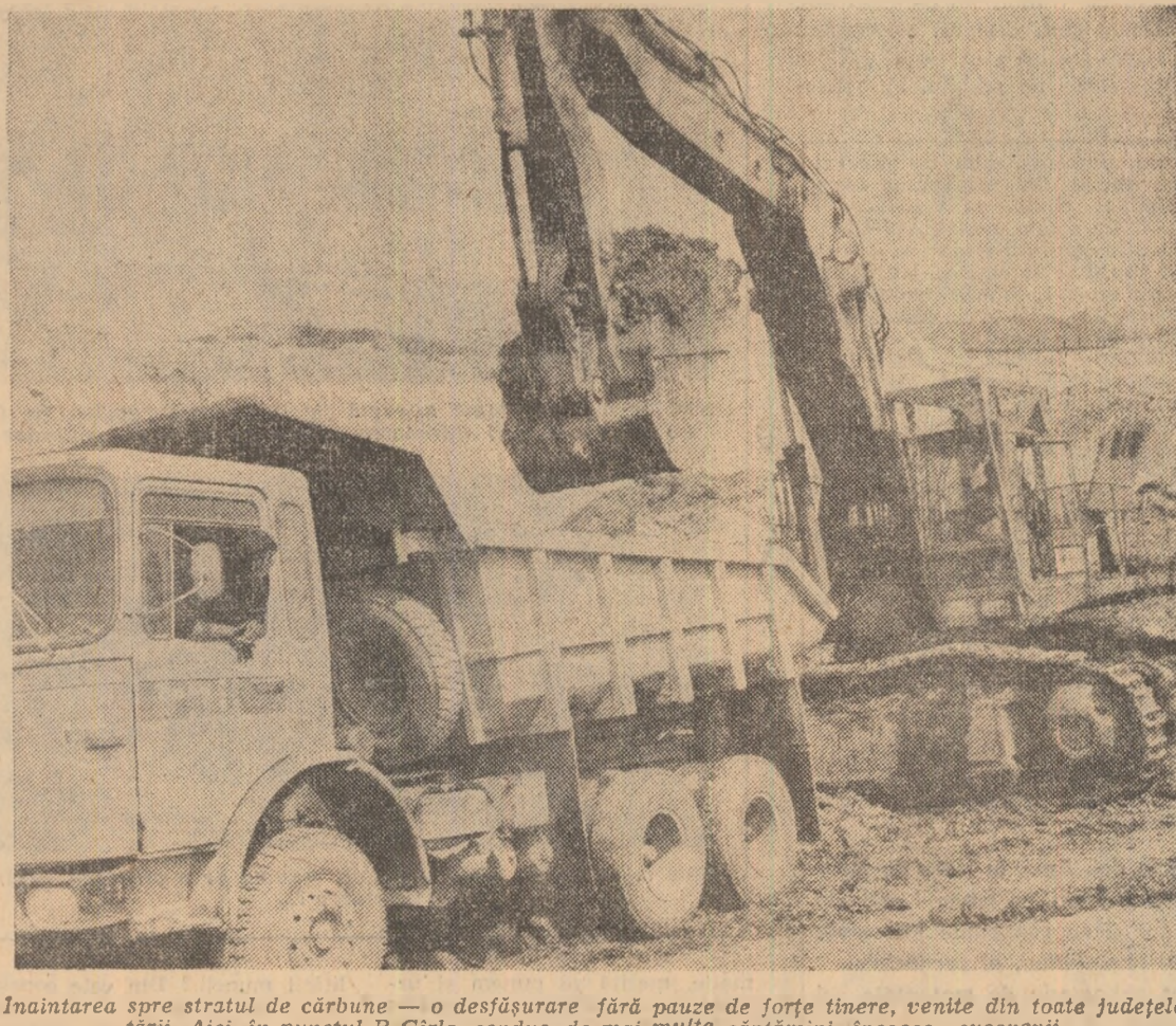
Înaintarea spre stratul de cărbune — o desfășurare fără pauze de forțe tinere, venite din toate județele țării. Aici, în punctul B Gîrla, conduc, de mai multe săptămîni încoace, suceveni

Ce lipsește — în afara pieselor de schimb — pentru ca rezultatele să se înscrie la nivelul sarcinilor de plan