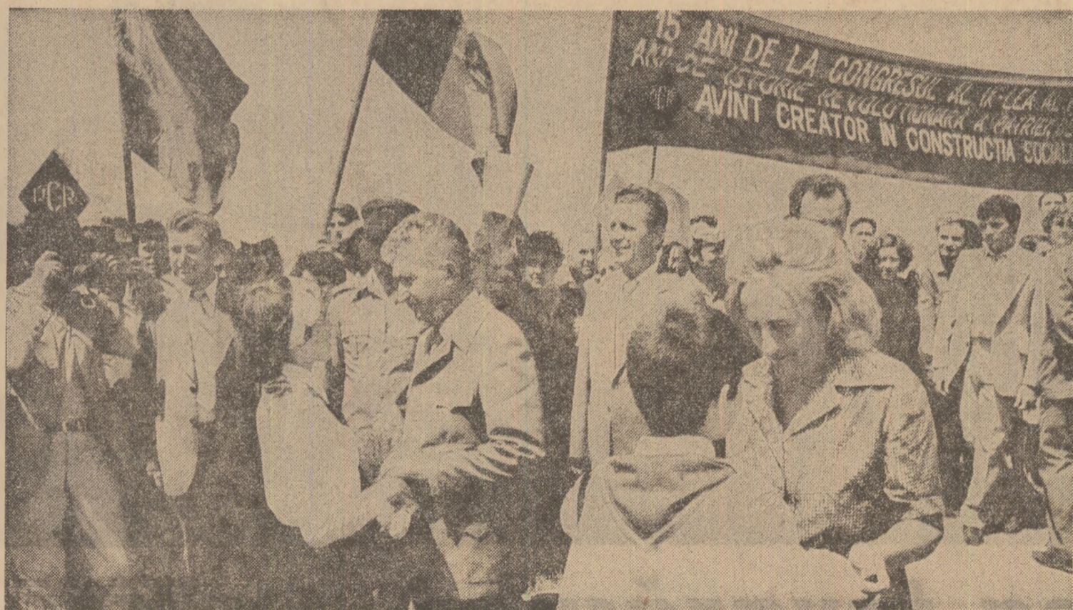
(Urmare din pag. a III-a)