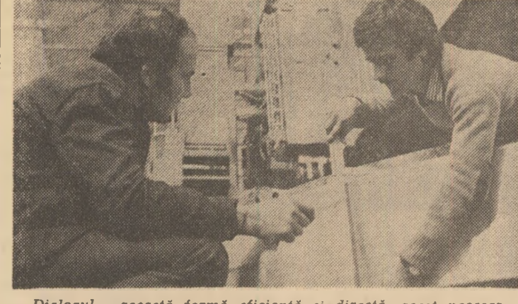
Dialogul, această formă eficientă și directă, acest necesar imbold în tot ceea ce gîndim și înfăptuim