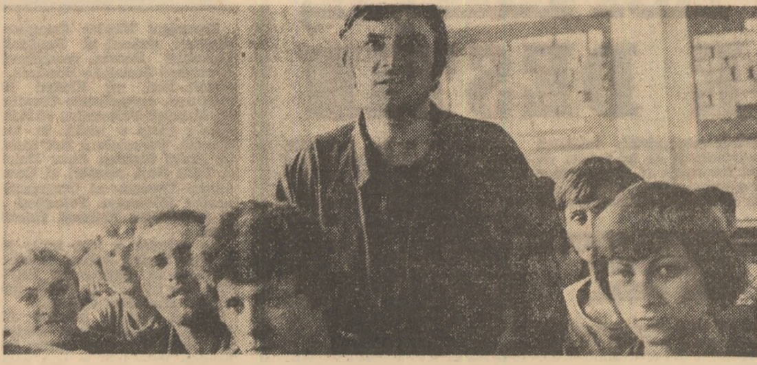
Adunarea U.T.C. — cadru amplu și stimulator de participare a tineretului la munca și viața întregului popor