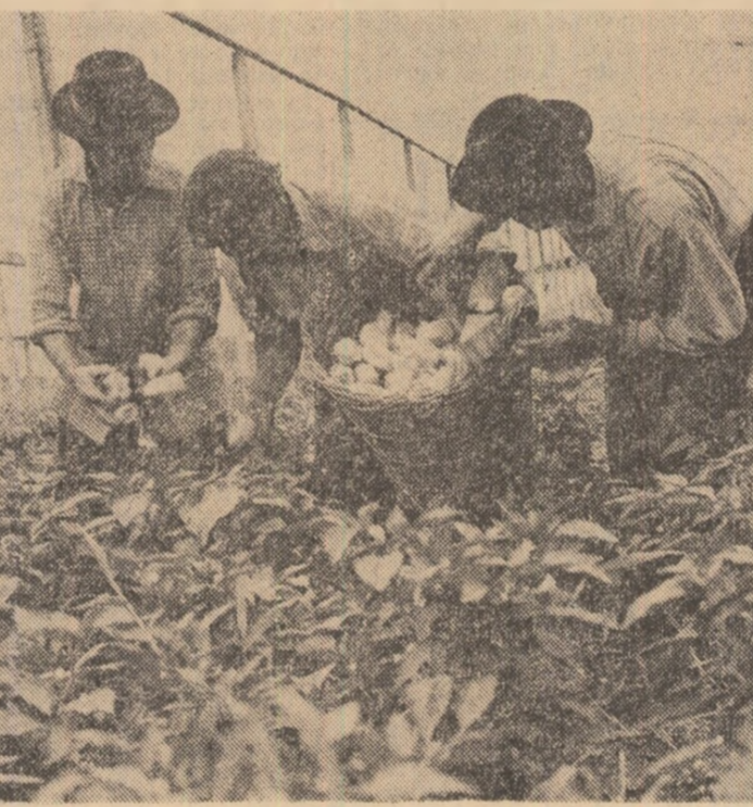
Secerșul grîului și recoltatul legumelor — două lucrări prioritare ale perioadei actuale

Marșul în cadrul Combinatului de prelucrare a lemnului din Rimnicu Vilcea a fost pus în funcțiune o modernă instalație pentru debitarea semifabricatelor necesare noii fabrici de scuno și s-a încheiat montajul unei alte instalații destinate mecanizării operației de alimentare cu semifabricate.