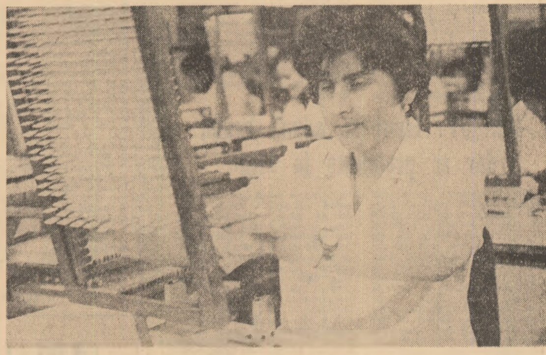
La întreprinderea de produse electronice și electrotehnice Curtea de Argeș, unitate al cărui colectiv de muncă a raportat îndeplinirea sarcinilor actualului cincinal cu aproape un an mai devreme, atestății înscriu zilnic alte importante sporuri în graficul producției.