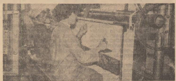
Aspect din secția I a cooperativii „Covorul” din Lăerme — Brașov