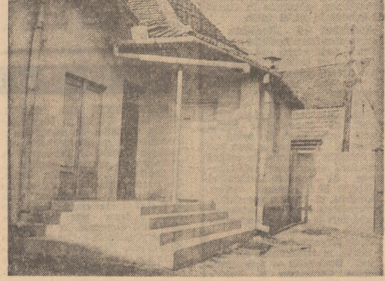
O intrare neospitalieră în spatele căreia nu bănuim o casă de cultură