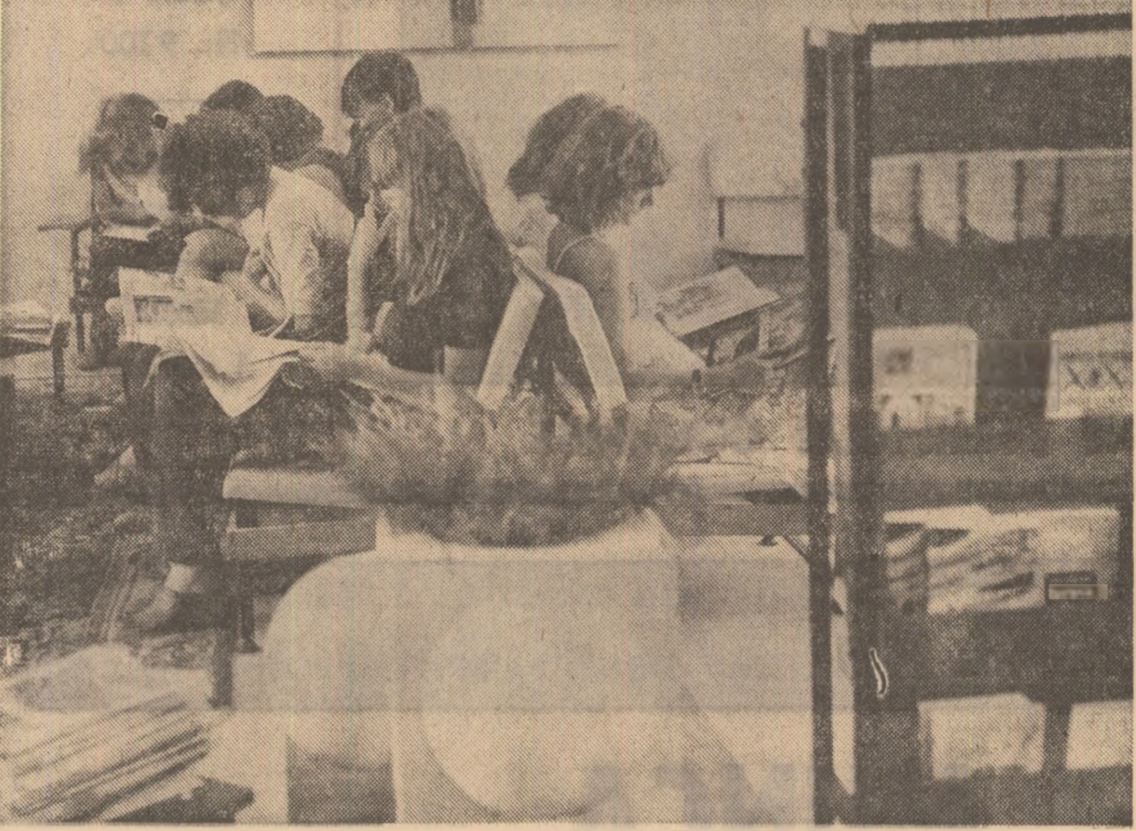
În tabără, la Costinești