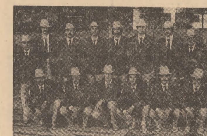
Lotul național de volei, cîștigător al medaliilor de bronz în turneul olimpic