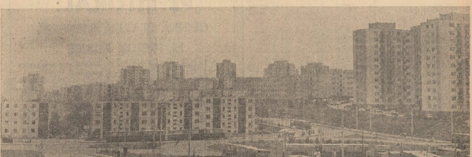
În pagina a 3-a: Reportaje realizate de brigada „Scintei tineretului” în județul Cluj

În acest August de intensă și neobosită muncă pentru țară, obiectivele marii întreceri socialiste, ale întrecerii tinerilor se completează cu un nou palmares de succes. Ele sînt demonstrația cea mai convingătoare a unității de nezdruccinat a locuitorilor acestor plaiuri, a hotărârii lor de a-și construi viitorul prin acest eroism cotidian, posibil doar prin unitatea de idei și faptă, dăruite țării, națiunii noastre socialiste.