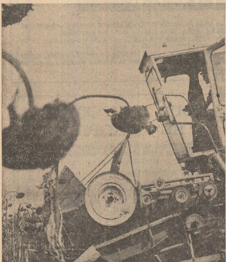
Recoltatul florii-soarelei - lucrare a campaniei de toamnă, ce trebuie efectuată cu maximă operativitate, a fost declanșată ieri în unele unități agricole din județul Dolj