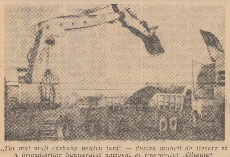
„Tot mai mult cărbune pentru țară” — deviza muncii de fiecare zi a brigadirului Șantierului național al tineretului „Oltenia”