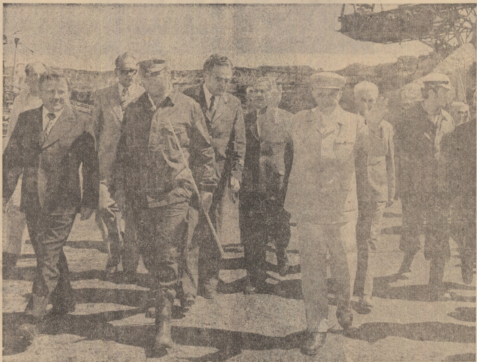
La cariera Lupoaia, se stabilesc noi măsuri pentru sporirea producției de cărbune

La plecarea din Capitală, secretarul general al partidului, președintele Republicii, a fost salutată de membrii și membrii pleceanți ai Comitetului Politic Executiv al C.C. al P.C.R., de secretari ai C.C. al P.C.R.