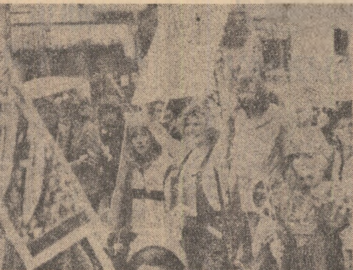
MAREA BRITANIE — Pe străzile Londrei s-a desfășurat recent o amplă demonstrație pentru dezarmare nucleară. „NU rachetelor Cruise în Marea Britanie!” — era scris pe una din lozinci

Vizitând pavilionul României, oficialitățile mozambicane au făcut aprecieri elogioase la adresa expozitelor prezentate.