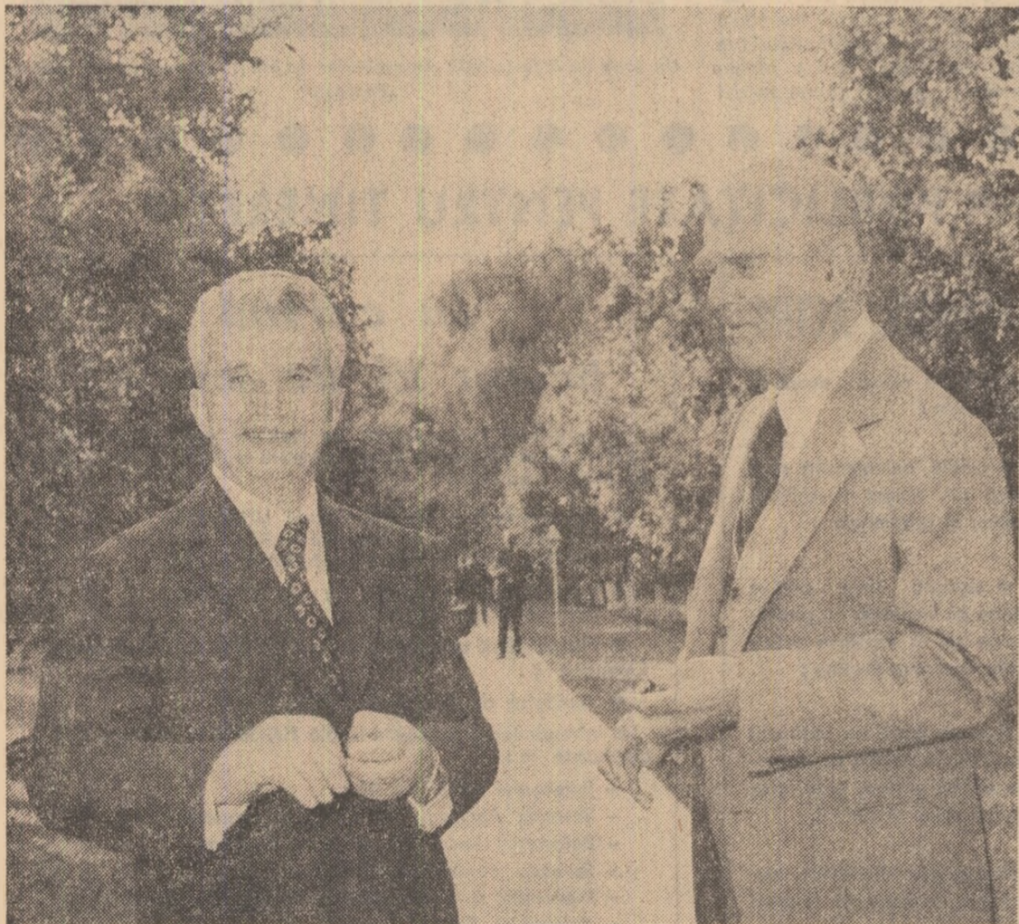
Președintele Republicii Socialiste România, tovarășul Nicolae Ceaușescu, s-a reîntîlnit joi după-amiază, la Snagov, cu pre-