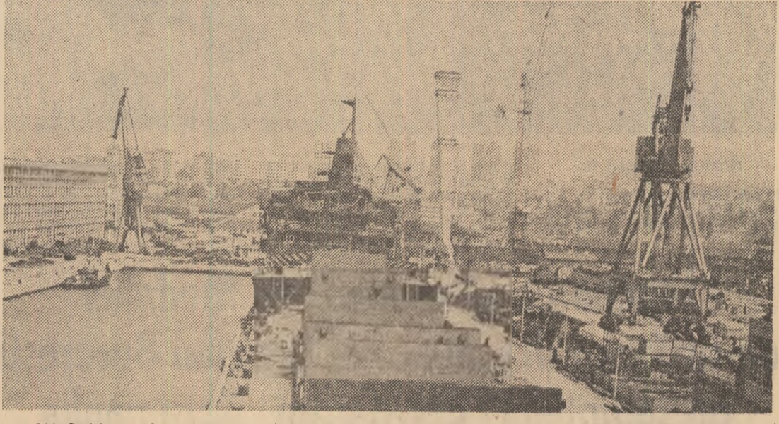
R.P. BULGARIA — Pe fundalul noilor construcții edilitare, instalațiile moderne ale șantierelor navale din Varna simbolizează parcă puterea economică a marelui oraș de la Marea Neagră

Scrisoarea precizează că Israelul, „a masat trupe” în sudul Libanului, în zona aflată în apropierea graniței cu Israelul.