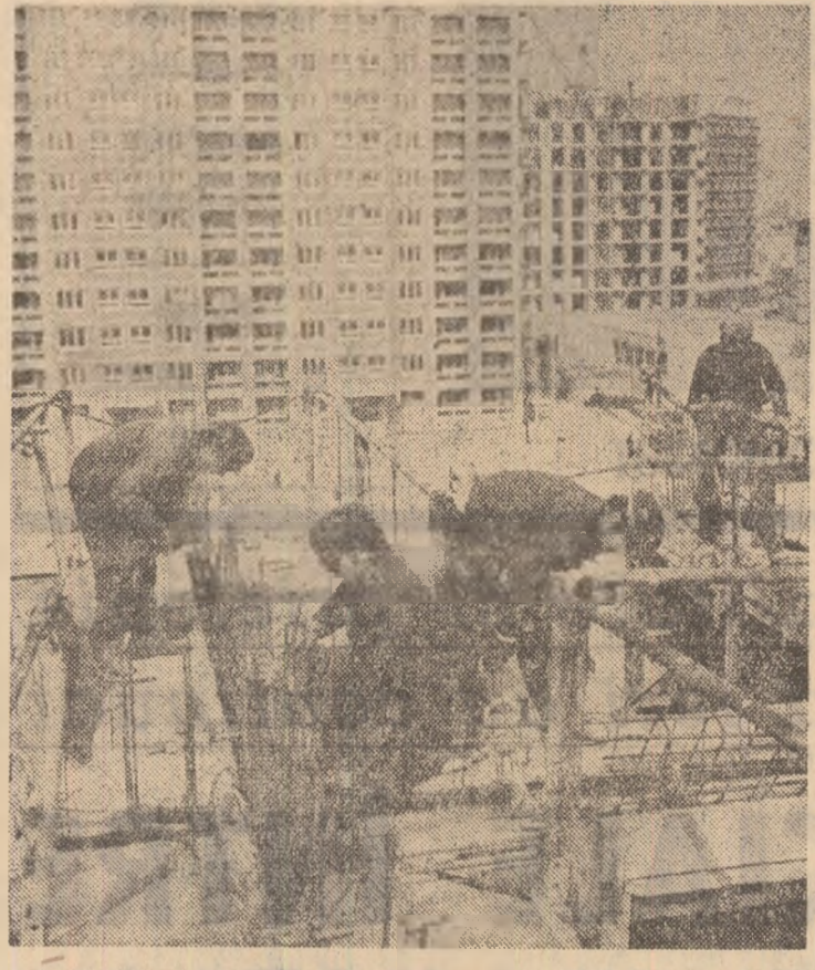
Construcții și construcții în zona Parcului tineretului