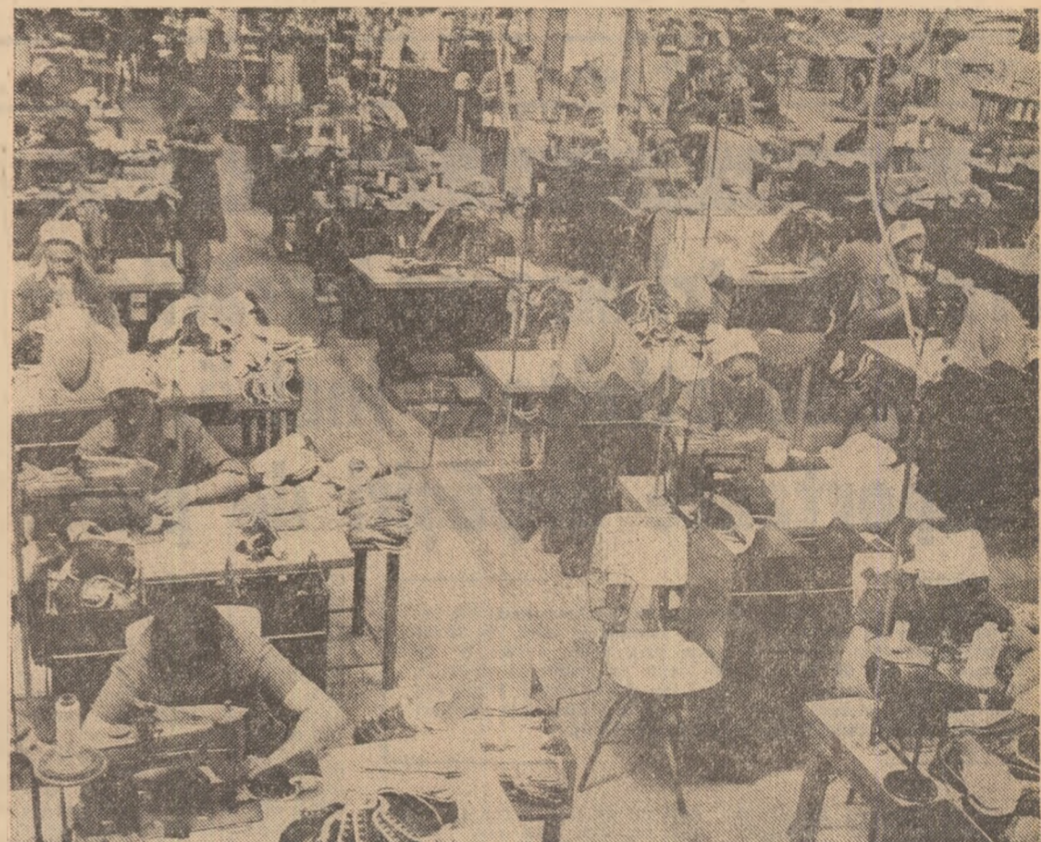
Secvență de muncă din Întreprinderea de talpă și încălțăminte din cauciu Drăgășani

Relevând convergența punctelor de vedere în majoritatea problemelor discutate, cei doi președinți au convenit să continue la Atena dialogul prietenesc româno-elen la nivel înalt, în interesul dezvoltării neîntrerupte a colaborării multilaterale dintre țările și popoarele noastre, al cauzei păcii, securității, înțelegerii și cooperării în Balcani, în Europa și în întreaga lume.