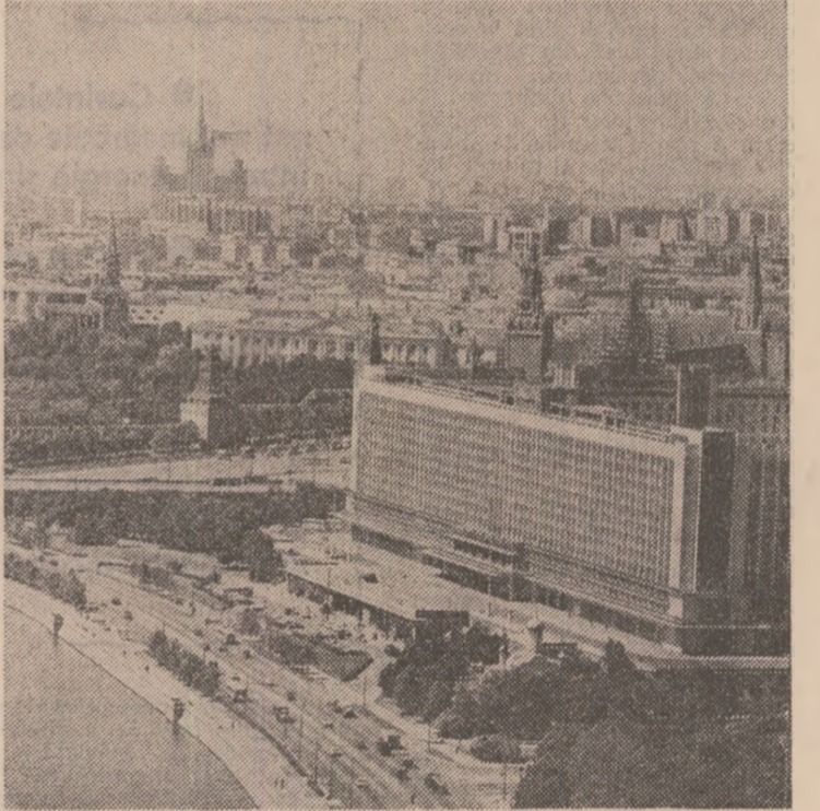
U.R.S.S. — Imagine din centrul orașului Moscova

Cu ocazia vernisajului, standul românesc a fost vizitat de Georgehi Iordanov, vicepreședinte al Consiliului de Mîntuire al R.P. Bulgaria, de alte persoane oficiale bulgare. Un interes deosebit a fost manifestat față de volumele din operele social-politice ale tovarășului Nicolae CEAUȘESCU. Au fost făcute aprecieri pozitive privind varietatea și diversitatea temelor expuse și în special ale literaturii tehnico-stiințifice, medicale și istorice.