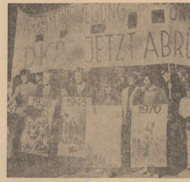
Acum, dezarmarea! Sintem împotriva războiului! Sub aceste dezlăsurări în numeroase orașe ale Europei occidentale demonstrații împotriva hotărârii N.A.T.O. de a amplasa noi rachete în Europa. În fotografie, aspect din timpul unei asemenea demonstrații desfășurate la Hanburg, în R.F.G.

La deschiderea tîrgului, pavilionul românesc a fost vizitat de președintele Consiliului de Miniștri al R. P. Bulgaria, Stanko Todorov, însoțit de alte persoane oficiale din conducerea de partid și de stat bulgară. Oaspeții au apreciat calitatea produselor expuse, subliniind, totodată, colaborarea fructuoasă, pe multiple planuri, între România și Bulgaria. Persoanele oficiale bulgare au fost salutate de ambasadorul României în Bulgaria, Petre Dumitrică.