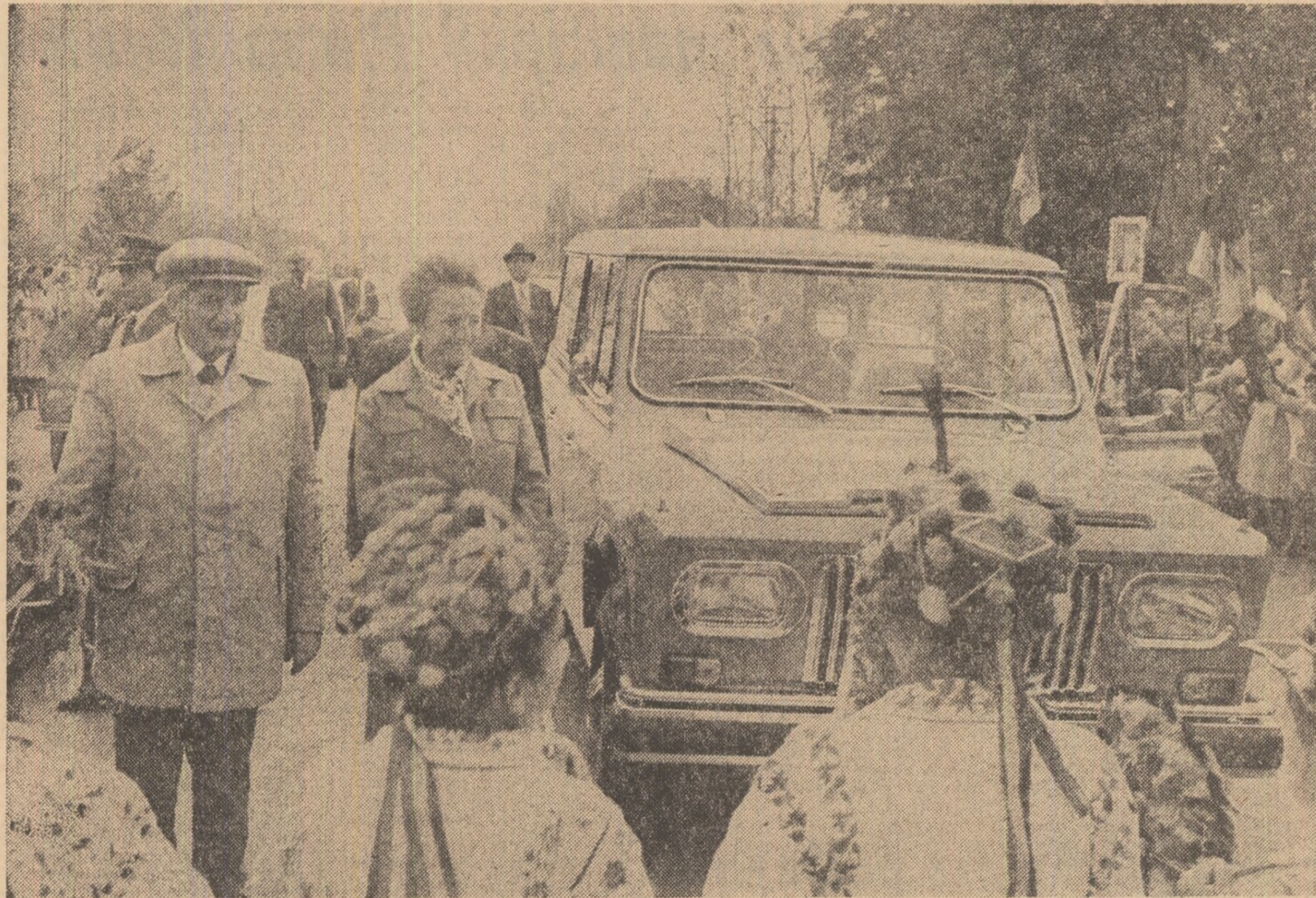
Tovarășul Nicolae Ceaușescu și tovarășa Elena Ceaușescu întâmpinați pretutindeni cu aleasă stimă și dragoste