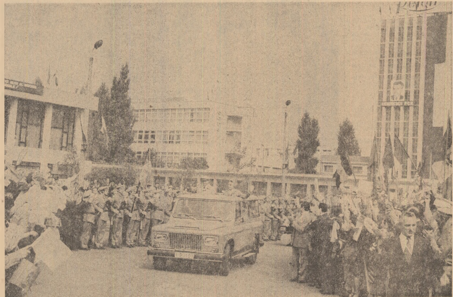
Călduroasă și entuziastă primire din partea tinerilor din Săvinești

Vă urez din toată inima succese tot mai mari în întreaga activitate, multă sănătate și multă fericire! (Aplauze și urale puternice, îndelungate; se scandează minute în sir: „Ceaușescu — P.C.R.”, „Ceaușescu și poporul!”). Într-o atmosferă de vibrant patriotism, de puternică unitate, toți cei prezenți la marea adunare populară ovacionează cu însuflețire pentru Partidul Comunist Român, pentru Republica Socialistă România, pentru secretarul general al partidului și președintele țării, tovarășul Nicolae Ceaușescu.