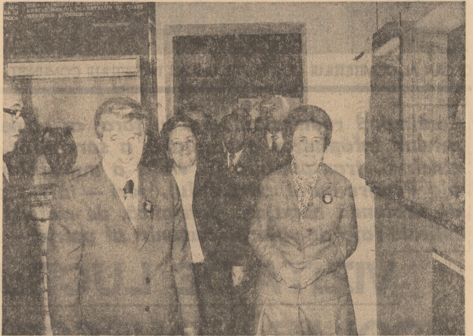
În sălile muzeului cuprinzând dovezi ale existenței multimișoare a poporului nostru pe aceste meleaguri

(Urmasc din pag. 1) Județul Neamț și a țării. Mil și mil de metalurgisti, constructori de mașini, chimisti și alți oameni ai muncii din unitățile economice, întreaga suflare a orașului participă la acest eveniment, scandind îndelung pentru partid, pentru secretarul său general. Dind glas sentimentelor locuitorilor orașului, ale tuturor oamenilor muncii de pe aceste meleaguri, tovarășul Gheorghe Mania, prim secretar al Comitetului județean de partid, adresează tovarășului Nicolae Ceaușescu, tovarășei Elena Ceaușescu un călduros bun venit. Se întonează Imnul de Stat al Republicii Socialiste România. O gardă alcătuită din militari ai forțelor noastre armate, membri ai gărzilor patriotice și ai formațiilor de pregătire a tineretului pentru apărarea patriei prezintă onorul. Tovarășul Nicolae Ceaușescu este salutată cu cântăre de membri ai Comitetului județean de partid, de Marin Apetrei, primarul orașului, de alți reprezentanți ai organelor locale de partid și de stat. În numele Comitetului Central al partidului, al Consiliului de Stat, al guvernului și al său personal, tovarășul Nicolae Ceaușescu adresează celor pre-