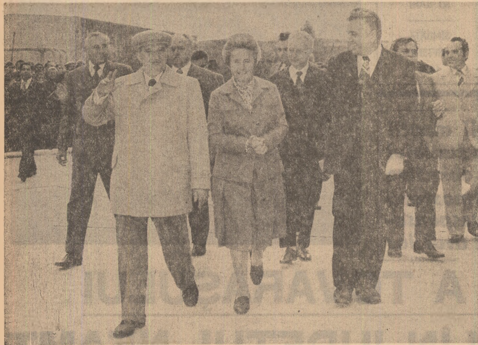
Moment din timpul vizitei de lucru pe platforma industrială a municipiului Roman