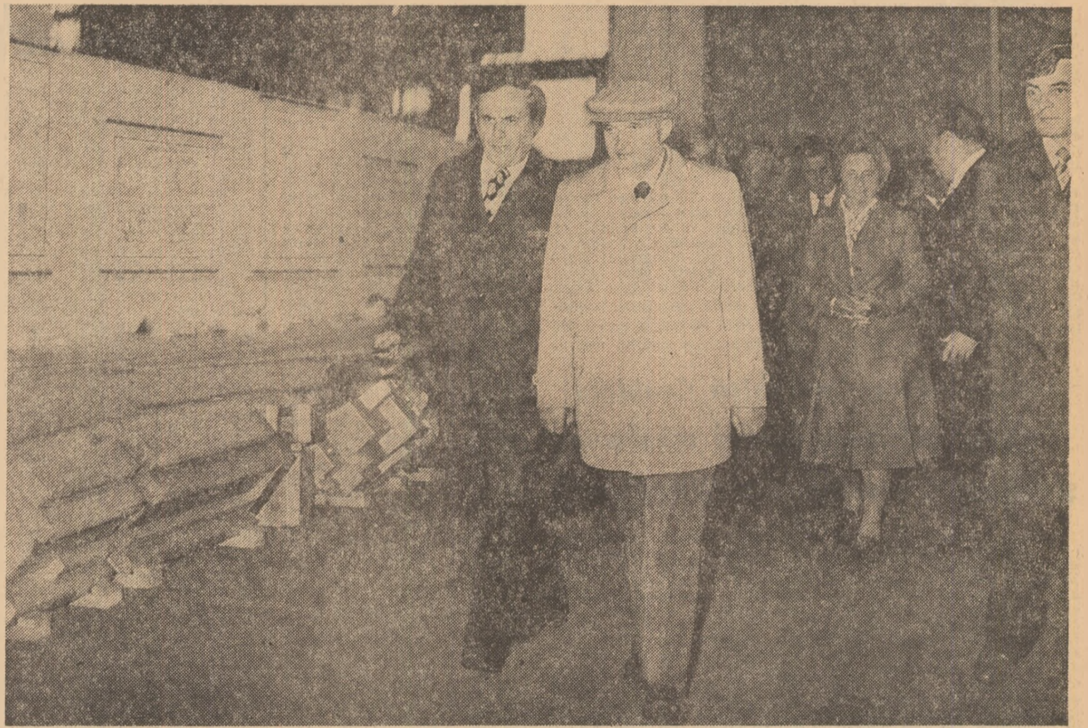
Secretarul general al partidului, oaspete al harnicului colectiv al întreprinderii mecanice din Roman