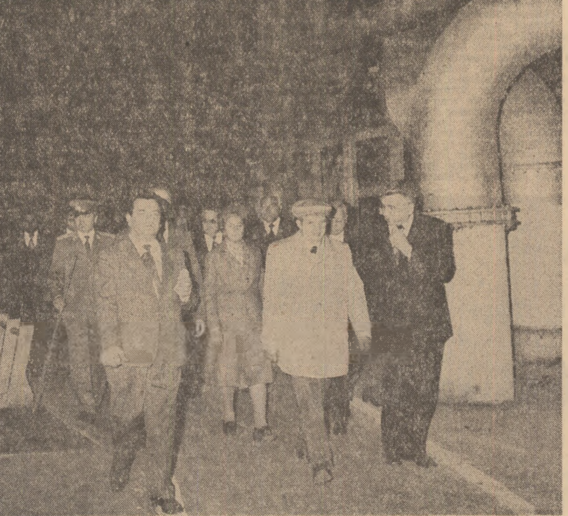
Fructuos dialog de lucru cu specialiștii întreprinderii de țevi din Roman