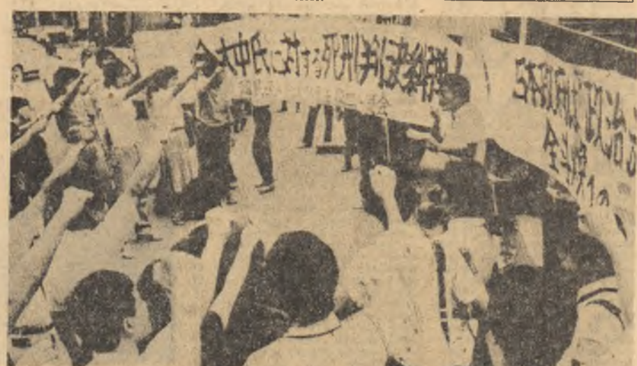
După înscenarea judiciară de la Seul, care s-a soldat cu condamnarea la moarte a cunoscutii personalități democratice din Coreea de Sud, Kim Doe Jung, pe străzile orașului Tokio a avut loc o puternică demonstrație de protest.

Rezoluția adoptată se pronunță pentru „o mai bună funcționare