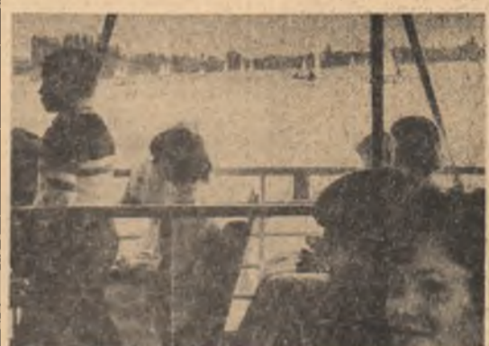
Ce poate fi mai plăcut decât o plimbare cu vaporasul duminică dimineața pe lacul Itești?