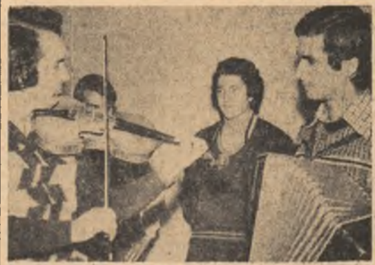
Succesul se obține prin străduință. E un lucru pe care îl știu atât de bine și membrii tineretului studențesc „Alunelul”, pe care aparatul de fotografiat l-a surprins la repetiții.