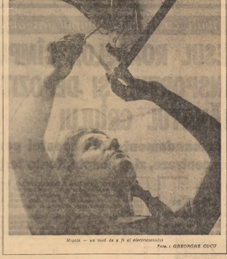
Migala — un mod de a fi al electricianului