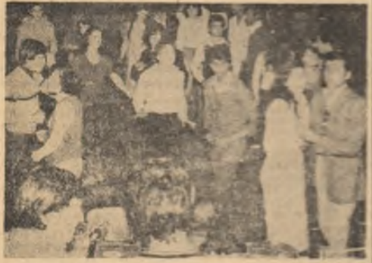
Efervescență și atmosferă agreabilă, prin caracteristicile sale pentru tineri, dansate de tineri la Ecran-Club.