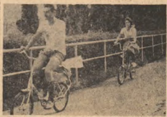
Continuatorii lui Macedonski într-o ipostază în care, ca și în literatură, poezia a fost un deschizător de drumuri la noi: ciclismul.