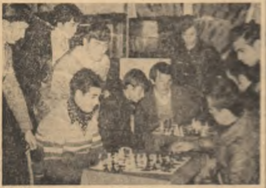
Concentrarea jucătorilor, concentrarea spectatorilor. O perioadă de sab, deci.