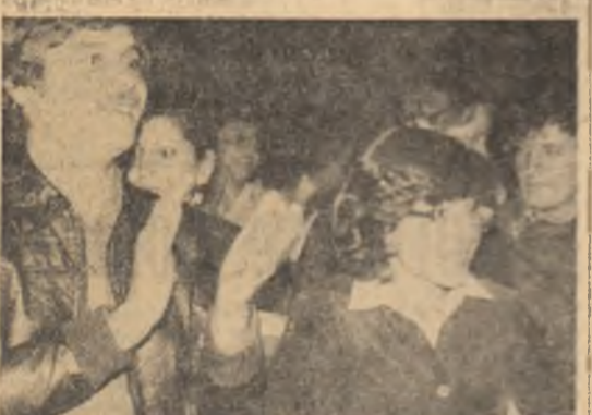
„Iar colegii lor din laboratoare art de pe băncile amfiteatrelor sint aceiași care le dăruie acum, fără zgîrcenie, meritele aplauze.