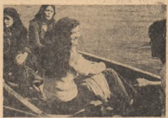
Pe lacul din Parcul Libertății un scurt abandon al viziilor, o sugestie de intrare a unui moment liric.