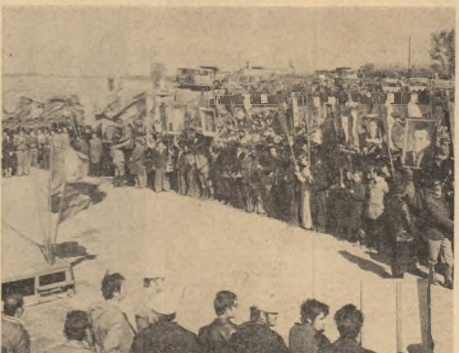
Imagine de la adunarea prielivă de încheierea „Acțiunii 7000”