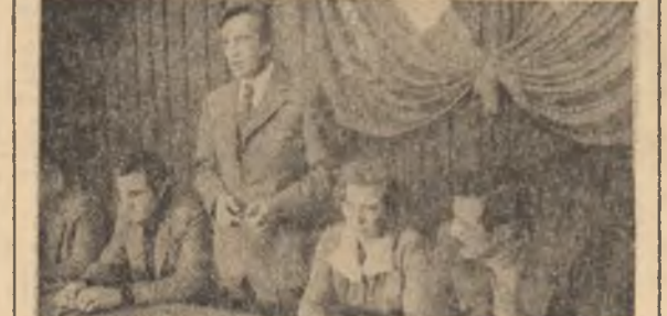
DRUMURI ÎN CUMPAȚA. Un tinar agronom intră în conflict cu un bîtrîn președinte de C.A.P. Deși, pînă la urmă, tinarul învinge pe președintele, filmul tot bîtrînesc rămîne