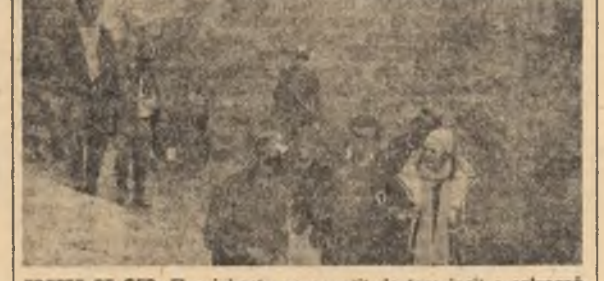
TREPE PE CER. El o iubește pe ea alături de toare încă o solvătoare. Bine era dacă solva filmul!

Pește să pară paradoxal, dar una dintre aceste epuze mi se pare a fi lipsa unei coeziuni artistice creatoare în cadrul unei generații de cinești (coeziune absolut necesară în contextul unei arte colective așa cum este filmul) — lipsă care provine din orizontul și individualismul exacerbat al multora dintre creatorii de film.