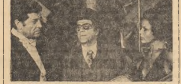
AL TREILEA SALT MORTAL. Cînd scenariul e cum o, nici un prestigios actor de talia lui Iosefini nu-l poate ascunde corențele