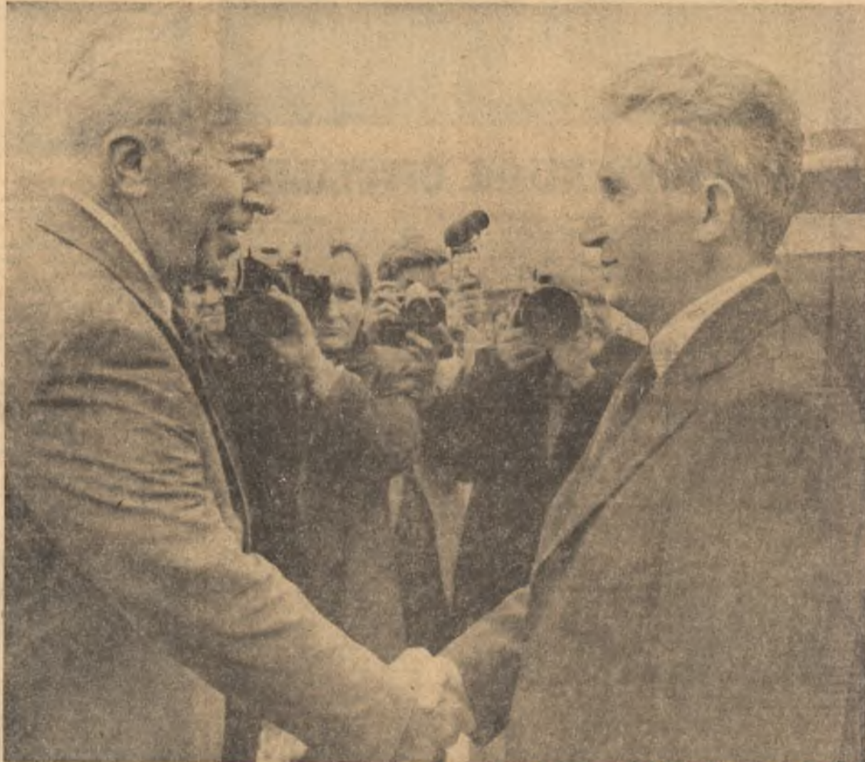
tovarășii Tsvetin Miatovici și Lazar Moisoiv, s-au îndreptat spre reședința ce a fost rezervată înălților oaspeți în orașul Beograd. De-a lungul traseului străbătut de coloana oficială escortată

De la aeroport, tovarășii Nicolae Ceaușescu și tovarăsa Elena Ceaușescu, împreună cu