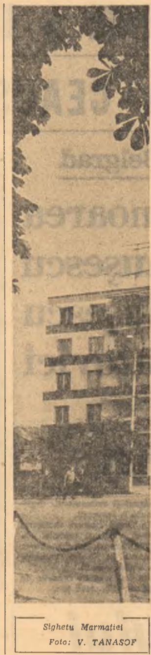
Sighetu Marmatiei

Ne-am propus ca în viitorul deceniu să devenim independenți din punct de vedere energetic. Să asigurăm prin propriile forțe baza energetică și de materii prime necesară dezvoltării economiei în ritmurile stabilite, ridicării continue a nivelului nostru de bunăstare. În fapt, acest lucru este posibil numai prin dezvoltarea activității științifice și tehnologice, precum și prin intensificarea preocupărilor manifestate în direcția utilizării altor surse de energie. Pe de altă parte, presupune acțiuni hotărâte în întreprinse în scopul gospodăririi judicioase a tuturor resurselor, reducerii consumurilor energetice și materiale.