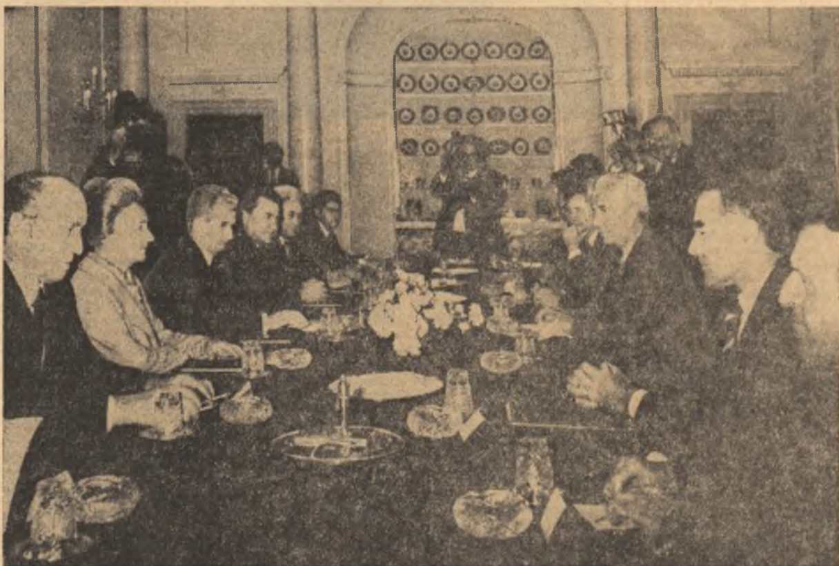
La Belgrad au început, miercuri, 22 octombrie, convorbirile oficiale între tovarășul Nicolae Ceaușescu, președintele Republicii Socialiste România, și tovarășul Tsvetin Miatovici, președintele Prezidiului Republicii Socialiste Federative Iugoslavia.