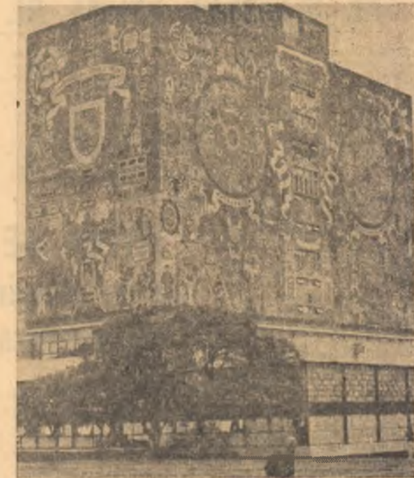
MEXIC: Imagine a impunătorului edificiu al Bibliotecii naționale din Ciudad de Mexico, capitala țării

În cursul zilei de miercuri — relatează agențiile M.E.N. și