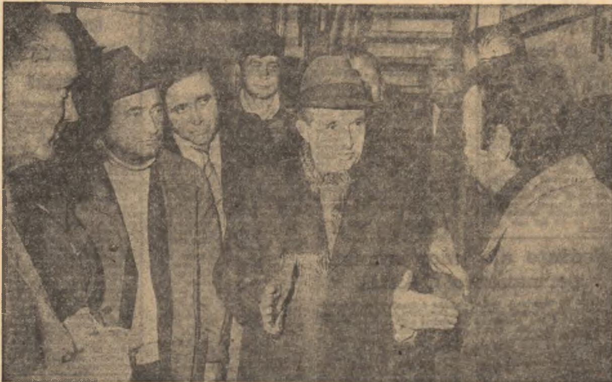
La întreprinderea pentru industrializarea sfeclii de zahăr Sascuț, județul Bacău