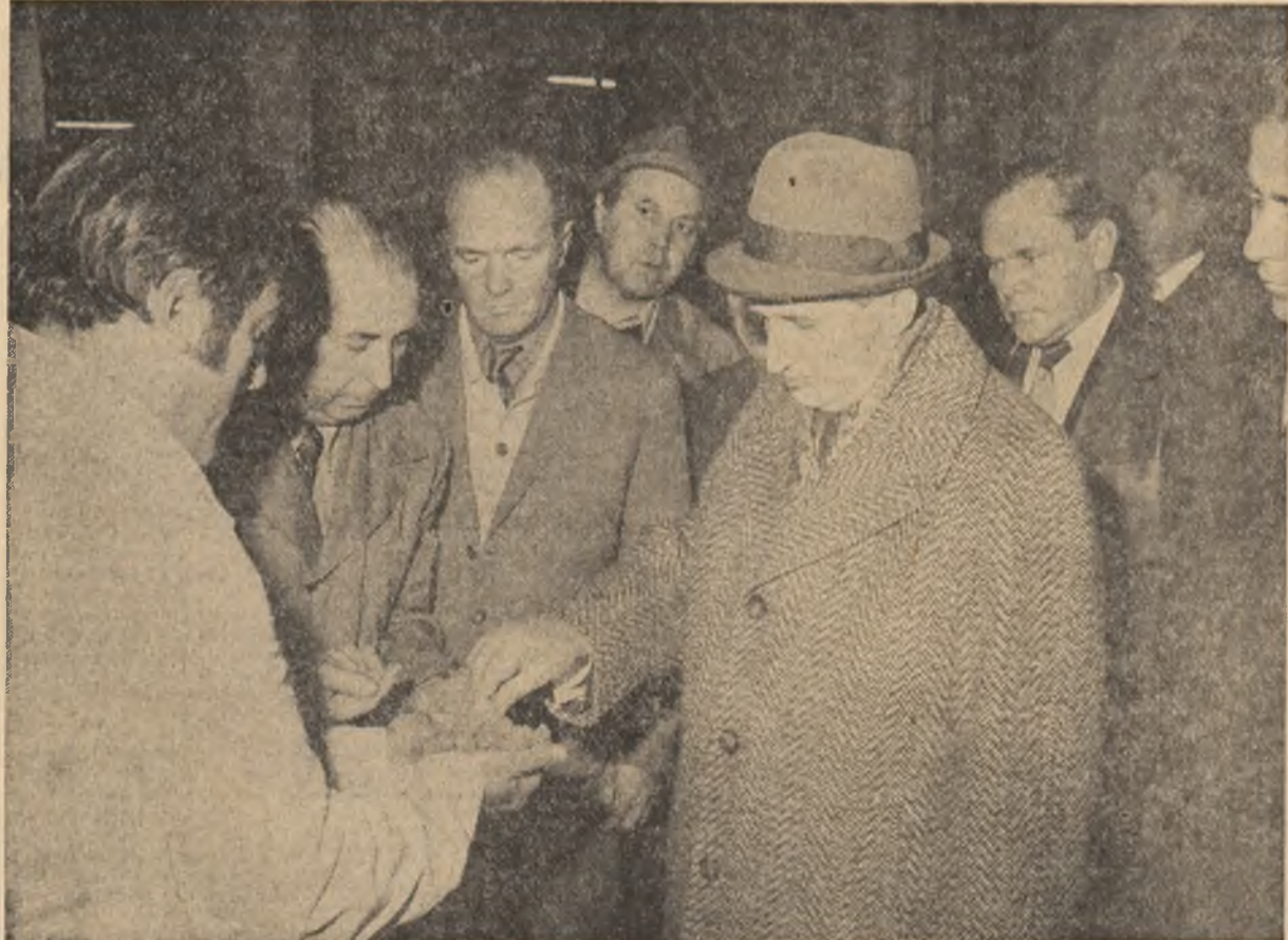
Giurgiu — o mai bună utilizare a spațiilor de producție

GABRIELA HUREZEAN (Continuare în pag. a III-a)