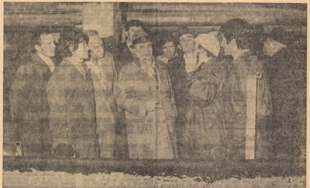
Analiza efectuată a continuat la întreprinderea pentru industrializarea sfeclii de zahăr Urziceni