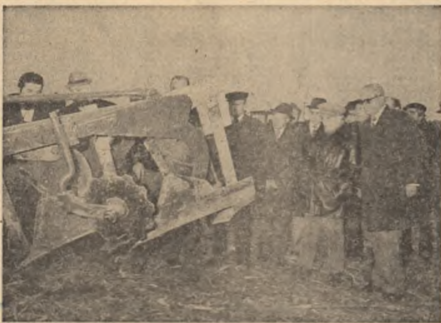
Otopeni: la lucru noue varianta de pluguri pentru tractoarele de mare capacitate

Sub semnul acestor preocupări s-au desfășurat și analize efectuate marți în domeniul perfecționării mecanizării agriculturii, și în ce privește dezvoltarea producției de zahăr, vizitele de lucru, prin caracterul lor concret, prin concluziile desprinse în cadrul dialogului purtat cu specialiștii, cu cadre de conducere, reflectând o dată mai mult stilul de lucru direct, eficient, al secretarului general al partidului, grija sa deosebită pentru bunul mers al activității în toate domeniile, pentru îndeplinirea în cele mai bune condiții a hotărârilor Congresului al XII-lea privind dezvoltarea economiei naționale, creșterea producției materiale și, pe această bază, ridicarea continuă a nivelului de trai al întregului popor.