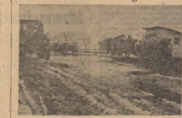
La Moara Vlăsiei, cei ce are patru rali transportă din câmp legumele... dar la C.I.F. Buftea se mai așteaptă încă mijloacele care să preia recolta contractată

În multe ferme legumicole se muncă înăseamnă cantități de legume, țepușe și piștele au surprins nerecoltate tomatele, ardeii pe întinse suprafețe în grădiniile din județele Constanța, Iași, Tulcea, Ilfov și alte. Din datele centralizate la Trăstie horticolă al județului Ilfov, bunăoară, rezultă că numai în zona fabricii „Valca Rosie” mai sînt de cules cîteva mii de tone de legume din sortimentele perisabile. Restanțele acumulate atît la fabrică, cît și la producătorii se datoresc în principal deficiențelor în organizarea muncii la cules și la transport. În cazul fabricii „Valca Rosie”, deși au fost zile bune cînd se putea recolta din plin, s-a tot amînat stringerea pentru salcarea producției, dar aceste acțiuni trebuie mult intensificate pînă la stringerea ultimului kilogram de recoltă.