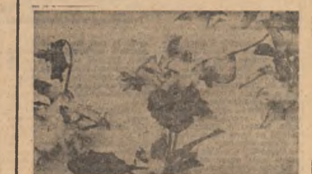
O imagine inedită din albumul de surprize al anotimpului pansulei în... zăpadă.